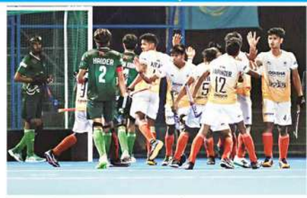
نیو دہلی (ایم این این) ایشیا کپ فائنل میں ہندوستان نے پاکستان کو ہرا کر ایشیا کپ کے فائنل میں داخل ہو گیا۔