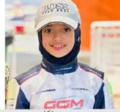
تفہیق میر کا یونان میں تاراجی کلین سویپ

ہندوستانی ہائی کمیشن کو کیا چاروں شائے چت کر دیا