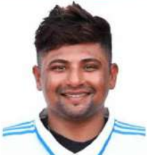
مرکز خان کا جھگی پیتائی اور خطاب ہینتے کا عزم

ساٹوک - چراغ سنگا پور اپن کے کسی فائل میں داخل