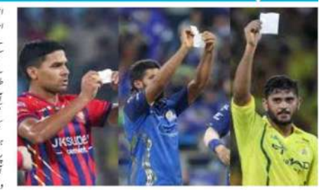
آئی پی ایل 2026 میں پرچی سیلبریشن کے دوران ٹی وی پر ایک لمحہ کے لیے سیلبریشن کی اجازت دینا ایک نیا 'ٹریڈ آف' بن گیا ہے۔ اچھی طرح سے منظم ہونے کے بعد پرچی کھانے کا کارڈ بھی دیا جائے گا۔

اٹھائے ہیں۔ ہندوستان کے سابق کرکٹر اور آئی پی ایل کی ٹی وی سٹیٹسٹوں کے لیے ایک نیا 'ٹریڈ آف' بن گیا ہے۔ اچھی طرح سے منظم ہونے کے بعد پرچی کھانے کا کارڈ بھی دیا جائے گا۔