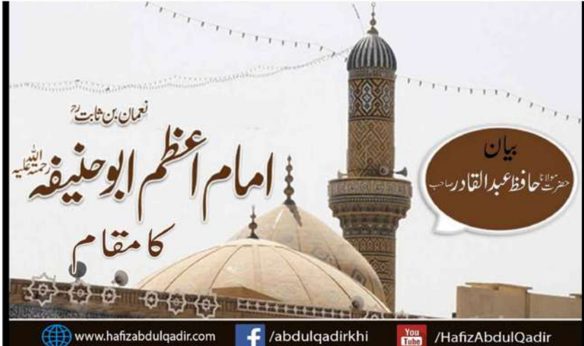
www.hafizabulqadir.com | f/abdulqadirakhi | You Tube /HafizAbdulQadir