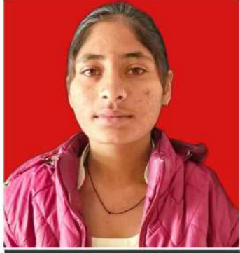
تحریر... مرلی کماری بیکانیر، راجستھان

تاہم، طلباء کو اپ گریڈیشن سے زیادہ فائدہ ہوتا دکھائی نہیں دے رہا ہے کیونکہ اسکول میں تقریباً کئی طرح کی بنیادی سہولیات کا فقدان ہے۔ لڑکیوں کے لیے نہ تو بیت الخلاء کا مناسب انتظام ہے اور نہ ہی پینے کے صاف پانی کا انتظام ہے۔ اس حوالے سے ایک اسکول کی طالبہ نے نام ظاہر نہ کرنے کی شرط پر بتایا کہ اسکول میں سب سے بڑا مسئلہ اساتذہ کا ہے۔ کئی مضامین کے لیے اساتذہ نہیں ہیں۔ یہاں تعینات اساتذہ بھی وقت پر نہیں آتے۔ انہوں نے بتایا کہ اسکول کے زیادہ تر اساتذہ دوسرے بلاس یا شہروں کے رہائشی ہیں۔ جو ہر روز آتے اور جاتے ہیں۔ ایسے میں وہ بھی وقت پر تو اسکول نہیں آتے ہیں لیکن وقت سے پہلے ضرور چلے جاتے ہیں۔ ایک اور طالبہ کا یہ بھی کہنا تھا کہ اس اسکول کی صرف عمارت ہی اچھی ہے، اس کے علاوہ کسی قسم کی کوئی سہولت نہیں ہے۔ والدین نے اسکول میں اساتذہ کی کمی اور ان کے دیر سے آنے اور جلدی جانے کی شکایت اعلیٰ حکام سے کی تھی۔ لیکن آج تک اس پر کوئی کارروائی نہیں ہوئی۔ انہوں نے بتایا کہ اسکول میں لڑکوں سے زیادہ لڑکیاں ہیں۔ اس سے تعلیم کے تئیں ان کے جذبے کا پتہ چلتا ہے۔ لیکن جب لڑکیاں اسکول آتی ہیں اور اساتذہ کی کمی کی وجہ سے کلاسز نہیں ہوتیں تو بہت دکھ ہوتا ہے۔ کئی بار اساتذہ صرف کھانا پورٹی کرنے کے لیے کلاس میں آتے ہیں۔ آئرس کے اساتذہ سائنس کے مضامین پڑھانے آتے ہیں۔ ایسے میں وہ کیا پڑھائیں گے؟ اس کا اندازہ آسانی سے لگایا جاسکتا ہے۔ ایک اور طالبہ کا کہنا تھا کہ اسکول میں سیکوریٹی کا کوئی نظام نہیں ہے۔ جس