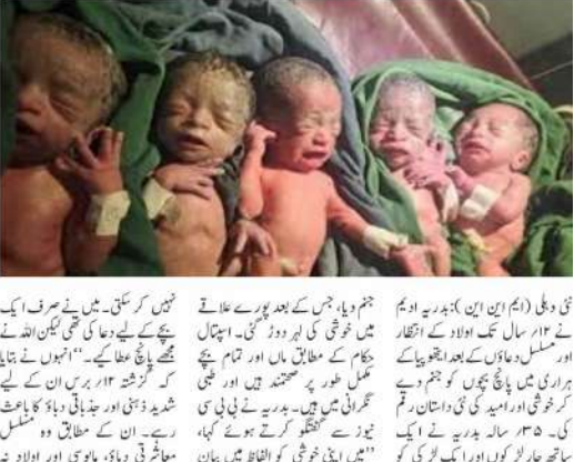
نئی دہلی (ایم این این) ایتھوپیا میں 12 سال بعد مان بننے کا خواب حقیقت بنا، پانچ بچوں کو جنم دیا۔

ایتھوپیا میں 12 سال بعد مان بننے کا خواب حقیقت بنا، پانچ بچوں کو جنم دیا۔