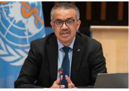
ڈی جی ایچ او کے ڈائریکٹر جنرل Tedros Adhanom Ghebreyesus

ہیڈ میڈیکل ایئر لائنز کے سربراہ کیسٹن کی جرائز روانہ کی گئی ہیں۔ انہوں نے کہا کہ انہوں نے اس وقت تک مسافروں کو روکا نہیں ہے کہ ان کے ممالک کی صحت سے متعلق ڈیٹا چھپا رہا ہے۔