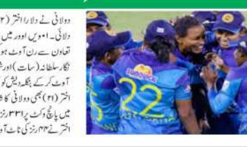
دہلی (ایم این این)۔ بنگلہ دیش کی خاتون ٹیم کو شکست دے کر سری لنکا کا سیریز پر قبضہ۔