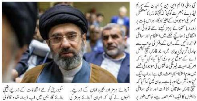
آجائے ہمز اور ہجرہ عمان کے ذریعے۔ سیدرینی کو سنے انکشافات کے ذریعے جتنی آئی ہے کہ ایران آجائے ہمز کی

دعا ہے جی میں شامل ہوں گے۔ ان کے مطابق یہ سب فریم ورک خطے کے تمام ممالک کیلئے استحکام، برتری اور معاشی فائدہ لائیں گے۔ سپریم لیڈر نے کہا کہ خلیج فارس کے ممالک ایک مشترکہ مستقبل رکھتے ہیں اور ہر دینی عنصر، جو ہزاروں کلومیٹر دور ہیں، اس خطے کے مستقبل میں کوئی کردار نہیں رکھتے۔ بیان میں ایک نئے علاقائی نظام کے اجراء کا بھی ذکر کیا گیا جو عالمی شہس رفت سے جسم لے رہا ہے۔ یہ بیان ایسے وقت میں سامنے آیا ہے جب ۸۲ فروری کو شروع ہونے والی ایران، امریکہ اور اسرائیل کے درمیان جنگ کے بعد سیدرینی میں اضافہ ہوا جس سے آجائے ہمز