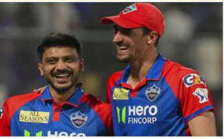
دہلی (ایم این این)۔ دہلی کی ٹیم نے اجستھان اور دباؤ کا شکار ہو کر شکست کھائی۔ دہلی کی ٹیم نے میچ میں 28 رنز بنائے اور اجستھان کی ٹیم نے 24 رنز بنائے۔