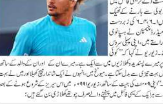
دہلی (ایم این این)۔ فیڈر، ندال اور سزگی کامیابی کی برابری کر کے یورپ میں۔