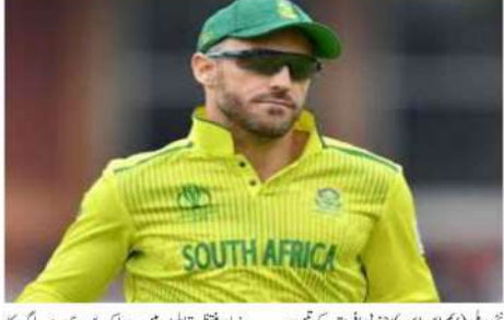
دہلی (ایم این این)۔ جنوبی روڈرز، ناف ڈوپلیس اور ہینرک کلاسنی نئی روڈرڈیم فرینچائز کے مالک بنے۔