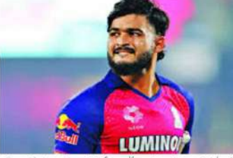
دہلی (ایم این این)۔ آئی بی ایل 20، ڈیریاں پراگ پروڈینگ کے لیے بیچ میں 25 فیصد جرمانہ عائد۔