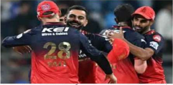
دہلی (ایم این این)۔ گجرات نے بنگلور کو چار وکٹوں سے شکست دی۔ بنگلور کی بیٹن جیٹ نے ایک وکٹ حاصل کی۔

دہلی (ایم این این)۔ گجرات نے بنگلور کو چار وکٹوں سے شکست دی۔ بنگلور کی بیٹن جیٹ نے ایک وکٹ حاصل کی۔ گجرات کی ٹیم نے میچ میں 28 رنز بنائے اور بنگلور کی ٹیم نے 24 رنز بنائے۔ گجرات کی ٹیم نے میچ میں 28 رنز بنائے اور بنگلور کی ٹیم نے 24 رنز بنائے۔