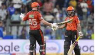
دہلی (ایم این این)۔ حیدرآباد نے ممبئی کو 6 وکٹوں سے شکست دی۔ حیدرآباد کی ٹیم نے میچ میں 28 رنز بنائے اور ممبئی کی ٹیم نے 24 رنز بنائے۔