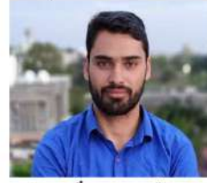
ترجمہ۔۔۔۔۔ ہارنٹس ڈوڈہ، جموں

روٹل دیکھنے کو نہیں ملتا ہے۔ جونہایت ہی افسوس کی بات ہے۔ ان کے علاوہ ضلع ڈوڈہ کے پہاڑی علاقے سے ایک خواتین نے بات کرتے ہوئے کہا کہ اعلیٰ تعلیم انسان کو اعلیٰ معیار کا بنا دیتی ہے کیوں کہ اس کے بعد آپ کا ذہن خود مختار رہنے کے لیے آپ کو مجبور کرے گا۔ انہوں نے اس بات کو بڑی مشیوٹی سے بیان کرنے کی کوشش کی کہ جب خواتین اعلیٰ تعلیم ہو گئی تو اس کے ذہن میں زندگی بسر کرنے کے بہترین خیالات پیدا ہوتے ہیں۔ تعلیم انسان کو بہتر انسان کی طرح جینا سکھاتی ہے۔ اور بہترین زندگی گزارنے کے لیے انسان خود مختار ہونا لازمی ہے۔ لیکن ایک عورت اس وقت تک خود مختار نہیں ہو سکتی ہے جب تک اس کا ذہن آزاد نہیں ہو اور یہ تعلیم کے بغیر ممکن نہیں ہو سکتا ہے۔ اگر ایک عورت کا ذہن غلامی کا شکار ہو تو وہ کبھی خود مختاری حاصل نہیں کر سکتی ہے۔ اس سلسلے میں ایک خاتون نے نیشنل ڈیجیٹل لٹریسیٹی کے لیے بتایا کہ ہاں، پہاڑی علاقہ کی خواتین کو اعلیٰ تعلیم سے سرفراز نہیں کیا گیا ہے۔ انہوں نے بتایا کہ یہاں تو میں رہنے والی خاتون کی طرح کے کام کرتی ہوں۔ ہم نے بہت کم خواتین کو دیکھا جو پہاڑی علاقوں میں سے تعلق رکھتی ہیں اور کسی بھی پروگرام میں حصہ لے پتی ہیں لیکن ان میں ایک ایسا معیار نہیں ہے جو انسانی کوشاقت دیتا ہے۔ جبکہ قابل تالیف اس بات سے ہوتی ہے کہ خاتون کو کم سے کم تعلیم دینے سے بھی روکا جاتا ہے۔ ایک تعلیم یافتہ خاتون اور ایک غیر تعلیم یافتہ عورت میں ذہن اور آسان کا فرق ہوتا ہے جبکہ یہاں یہ بات ضروری ہے کہ خواتین کو اعلیٰ تعلیم اگرچہ حاصل نہیں ہو لیکن کم از کم اعلیٰ تعلیم سے روشناس ہوں جس سے آپ کا ذہن معیار اس قدر ہو کہ آپ کے سامنے ایک بہترین زندگی بسر کر سکیں۔