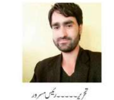
ترجمہ۔۔۔۔۔ رجنس سرور

ہے کہ جموں و کشمیر UT کے فیس بک کے صارفین کی بھاری اکثریت یہ دیکھ کر کافی مایوسی ہوئی کہ یوزر generated user (content) کا تیار کردہ زیادہ تر مواد براؤزروں یا توں پر مشتمل ہے۔ جسے سالانہ طور پر فیس بک کے پروجیکٹ پیجورز کی طرف سے ایک ٹریڈ شروع کیا گیا تھا جس میں وہ کچھ سا درجنوں لوگوں کو نشانہ بناتے تھے اور رزلو کرتے تھے۔ یہ سوشل میڈیا پوسٹوں سے جانتا ہوا ہے کہ انہوں نے اس طرح کی پوسٹیں کیا ہیں۔ یہ سوشل میڈیا پیجس بدقسمتی سے اسے منجول ہو گئے کہ چند ہی منٹوں میں لاکھوں فالوورز اور لوگوں کو رزلو کرنے اور ان کی توجہ کرنے والے ان غیر منہج مواد کو کھینچ کر ختم کر دیا۔