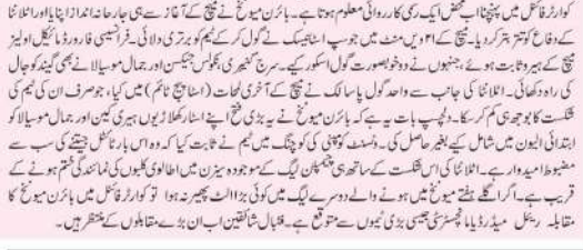
ٹی وی (ایم این این)۔ بائرن میونخ نے اٹلانٹا کو روڈنڈالا، کوارٹرفائنل میں رسائی یقینی بنائی۔