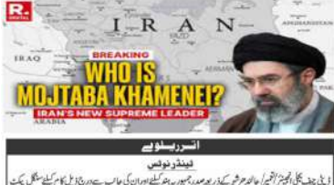
نیو دہلی (ایم این این) ایران کے سربراہ نے کہا کہ اگر امریکہ اور اسرائیل نے ہرمز کے علاقے کو ہتھیار بنایا تو انہوں نے خود کو تباہ کر لیا۔ اس کے علاوہ...