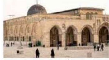
قاصی مسجد امریکہ اور امریکہ کی مشترکہ سفارت کے حاضر میں نام نہا ہو سکی حالت کا سارا دل رہے ہیں۔ اس قانون نافذ کرنے والے اداروں کو...