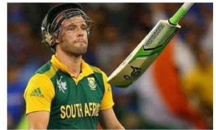
ٹی وی (ایم این این)۔ جنوبی افریقہ کے سابق کپتان کیٹی وائی ویلیئرز نے اپنے ٹی 20 ٹورنامنٹ کے دوران جنوبی افریقہ کے لیے ایک عمدہ کارکردگی پیش کی۔

دوران کچھ ایسے لمحات آئے جب بمرہ کی ہوٹنگ دیکھ کر کچھ لوگ کہہ سکتے ہیں کہ ٹی 20 ٹورنامنٹ کا اعزاز دیا جانا چاہیے تھا۔ اے بی ڈی ویلیئرز نے بتایا کہ بمرہ کو سب سے زیادہ ووٹ حاصل کرنے اور اسی وجہ سے وہ پلیسر آف دی ٹورنامنٹ کے مشہور امیدوار تھے۔ ان کے کچھ خاص اور اہم لمحوں میں کارکردگی نے جنوبی افریقہ کے لیے سب سے اہم کردار ادا کیا۔ اے بی ڈی ویلیئرز نے کہا کہ ”جنوبی افریقہ میں فاسٹ بالر کے طور پر پلے کرنا آسان نہیں ہے، جب تک کہ آپ بمرہ نہ ہوں۔ وہ ضروری وقت پر ایک الگ الگ کیریئر چلا جاتا ہے اور وہ بل ڈنٹل ہے۔ وہ ایک حقیقی آف اسپن ہیں۔“ ویلیئرز نے جنوبی افریقہ کے لیے 10 ٹیسٹوں میں بمرہ کو 11 ووٹ حاصل کیے۔ وہ ووٹوں کے طور پر ویلیئرز کی کارکردگی کے ساتھ سب سے اوپر ہیں۔ تاہم