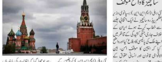
نیو دہلی (ایم این این) ہسپانوی وزیر اعظم پیڈرو سانشیز نے کہا کہ ہسپانوی حکومت نے ہم جنگ کے خلاف واضح موقف اختیار کیا ہے۔ انہوں نے...