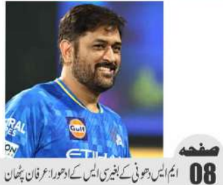
انہیں اہلس دھونی کے بغیر ایس کے اور اور عرفان بھٹان

”مشکل صورتحال کا مقابلہ کرنے کیلئے ہمیشہ تیار رہتا ہوں“