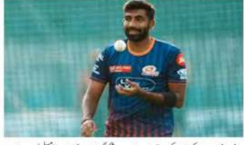
ٹی وی (ایم این این)۔ جنوبی افریقہ کے سابق کپتان کیٹی وائی ویلیئرز نے اپنے ٹی 20 ٹورنامنٹ کے دوران جنوبی افریقہ کے لیے ایک عمدہ کارکردگی پیش کی۔