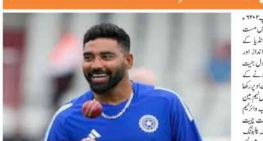
ٹی وی (ایم این این)۔ پاکستان کے کرکٹر محمد سراج نے اپنی جذباتی تقریر سے دل جیت لیا۔