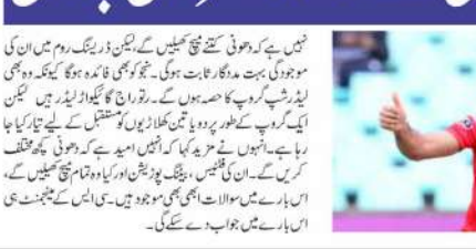
ٹی وی (ایم این این)۔ ایم ایس دھونی کے بغیر سی ایس کے ادھورا رہے۔