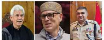
سرینگر 13 مارچ // ایس این این ایف کے مطابق شمالی کمان کے فوجی کمانڈر نے ہنسنت گڑھ علاقے میں سیکورٹی اور آپریشنل تیاریوں کا جائزہ لیا۔

سرینگر 13 مارچ // ایس این این ایف کے مطابق شمالی کمان کے فوجی کمانڈر نے ہنسنت گڑھ علاقے میں سیکورٹی اور آپریشنل تیاریوں کا جائزہ لیا۔ انہوں نے فوجیوں کی ثابت قدمی اور اعلیٰ تیاریوں کو سراہا۔