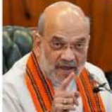
سرینگر 13 مارچ // ایس این این ایف کے مطابق وزیر اعظم کی قیادت میں سرکار ریاستی حکومتوں کے ساتھ کدھ سے کدھ ہمارا کرکھڑی راہیت شاہ کی منظوری ہوئی ہے۔