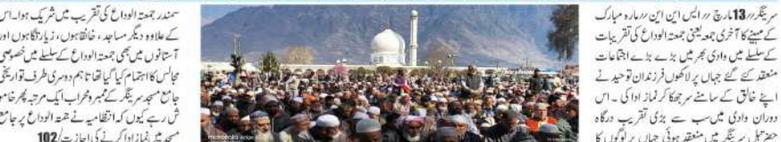
سرینگر 13 مارچ // ایس این این ایف کے مطابق وادی بھر میں جمعتہ الوداع کی تقریبات کے سلسلے میں وادی بھر میں بڑے بڑے اجتماعات منعقد کیے گئے۔ جہاں پر لوگوں کی فوجیں تھیں۔ اپنے خالق کے سامنے سر جھکا کر نماز ادا کی۔ اس دوران وادی میں سب سے بڑی تقریب درگاہ حضرت تیل میں منعقد ہوئی جہاں پر لوگوں کا سیلاب امڑ آیا۔

مساجد، خانقاہوں، زیارت گاہوں اور آستانوں میں خصوصی مجالس کا اہتمام درگاہ حضرت تیل میں لوگوں کا سیلاب امڑ آیا، جامع مسجد سرینگر کے ممبر و محراب خاموش