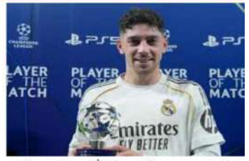
ٹی وی (ایم این این)۔ ریٹل میڈرٹے ٹی ٹی وی کی ہیٹ ٹرک نے والورڈے کی ہیٹ ٹرک کو دھول چٹھائی دیا۔

افغانی کرکٹرز کی فائدہ اٹھانے والے والورڈے نے ایک زور دار کارکردگی پیش کی۔