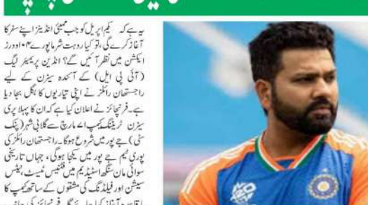
ٹی وی (ایم این این)۔ آکاش چوہڑا نے روہت شرما کو سب سے فٹ اور مضبوط کھلاڑی قرار دیا۔