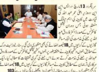
سرینگر 13 مارچ // ایس این این ایف کے مطابق وزیر اعلیٰ عمر عبداللہ کی قیادت میں کابینہ کا اہم اجلاس منعقد ہوا جس میں ڈاکٹر فاروق پر حملے کی مذمت کی گئی اور مسافر کرایوں میں 18 فیصد اضافے کی منظوری دی گئی۔