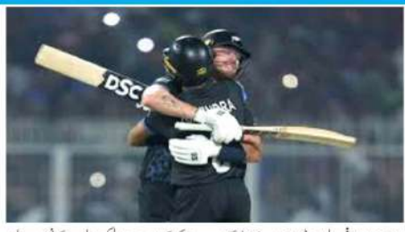
ٹی 20 ورلڈ کپ 2026 کی میزبانی کے لیے نیوزی لینڈ کو منتخب کیا گیا ہے۔

نیوزی لینڈ (ایم این این)۔ ٹی 20 ورلڈ کپ 2026 کو نیوزی لینڈ میں منعقد کیا جائے گا۔ نیوزی لینڈ نے ٹی 20 ورلڈ کپ 2026 کو نیوزی لینڈ میں منعقد کیا جائے گا۔