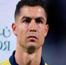
کرستیا نورونالڈو انگریزی کا شکار

ایرانی سمندری جہاز پر حملہ انتہائی قابل تشویش معاملہ جموں و کشمیر کے شہریوں کو واپس اپنے گھر لانے کا معاملہ مرکزی حکومت کے ساتھ اٹھایا گیا ہے