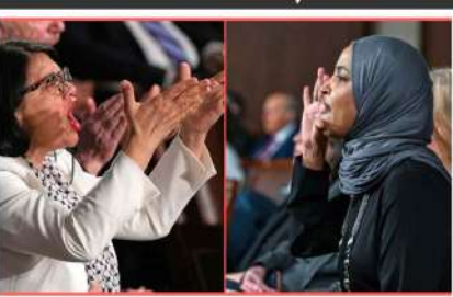
سیاست دانوں جیسا برتاؤ دیا گیا ہے، جہاں سے نکال دیا جانا چاہیے۔ ٹرمپ نے کہا، جب لوگ اس طرح کا برتاؤ دیتے ہیں، تو امریکہ کے ساتھ تعلقات کو بہتر بنانا چاہیے۔

کہا کہ وہ (الہان عمر اور راشدہ طلبہ) صرف امریکہ کے تعلق سے نہیں ہیں، وہ اس کی مدد کے لیے کوشش کر رہے ہیں۔ انہوں نے کہا کہ سعودی عرب نے اپنی پالیسیوں کو درست کرنے کی ضرورت ہے۔ انہوں نے کہا کہ سعودی عرب نے اپنی پالیسیوں کو درست کرنے کی ضرورت ہے۔ انہوں نے کہا کہ سعودی عرب نے اپنی پالیسیوں کو درست کرنے کی ضرورت ہے۔