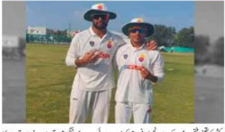
رنجی ٹرائی: آؤٹس ڈوسجا کی ناٹ آؤٹ سچری، دہلی اور ممبئی کا مقابلہ ڈرا۔ رنجی ٹرائی: آؤٹس ڈوسجا کی ناٹ آؤٹ سچری، دہلی اور ممبئی کا مقابلہ ڈرا۔

ٹی وی (ایم این این)۔ رنجی ٹرائی: آؤٹس ڈوسجا کی ناٹ آؤٹ سچری، دہلی اور ممبئی کا مقابلہ ڈرا۔ رنجی ٹرائی: آؤٹس ڈوسجا کی ناٹ آؤٹ سچری، دہلی اور ممبئی کا مقابلہ ڈرا۔