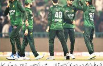
پاکستان نے آسٹریلیا کو 90 رن سے شکست دیدی، سیریز میں ناقابل تخیل برتری۔ پاکستان نے آسٹریلیا کو 90 رن سے شکست دیدی، سیریز میں ناقابل تخیل برتری۔

ٹی وی (ایم این این)۔ پاکستان نے آسٹریلیا کو 90 رن سے شکست دیدی، سیریز میں ناقابل تخیل برتری۔ پاکستان نے آسٹریلیا کو 90 رن سے شکست دیدی، سیریز میں ناقابل تخیل برتری۔