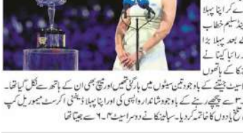
آسٹریلیا میں اوپن: الکاراز کے میڈیکل ٹائم آؤٹ پر زیور یو برہم۔ آسٹریلیا میں اوپن: الکاراز کے میڈیکل ٹائم آؤٹ پر زیور یو برہم۔

ٹی وی (ایم این این)۔ آسٹریلیا میں اوپن: الکاراز کے میڈیکل ٹائم آؤٹ پر زیور یو برہم۔ آسٹریلیا میں اوپن: الکاراز کے میڈیکل ٹائم آؤٹ پر زیور یو برہم۔