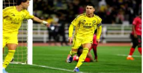
کرسٹیانو رونالڈو نے 92 آواں گول داغا، النصر کی فتح نے خطاب کی جنگ تیز کردی۔ کرسٹیانو رونالڈو نے 92 آواں گول داغا، النصر کی فتح نے خطاب کی جنگ تیز کردی۔

بڑھ رہا ہے جو بھی ہاتھ دکھائی دیتا تھا وہاں گول مار رہے ہیں۔ کرسٹیانو رونالڈو نے 92 آواں گول داغا، النصر کی فتح نے خطاب کی جنگ تیز کردی۔