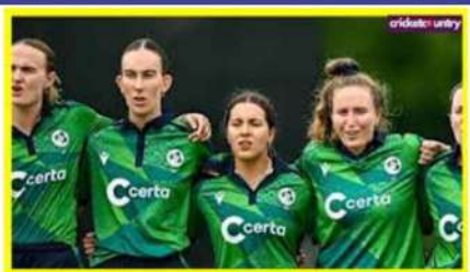
ٹی 20 ورلڈ کپ کیلئے کوالیفائی کر لیا۔ آسٹریلیا کی خواتین ٹیم کے کھیلوں کے سربراہ نے ٹی 20 ورلڈ کپ کیلئے کوالیفائی کر لیا۔ آسٹریلیا کی خواتین ٹیم کے کھیلوں کے سربراہ نے ٹی 20 ورلڈ کپ کیلئے کوالیفائی کر لیا۔

ٹی وی (ایم این این)۔ آسٹریلیا کی خواتین ٹیم نے شامدار کرکٹ کی کھانا کھانے کے بعد ٹی 20 ورلڈ کپ کیلئے کوالیفائی کر لیا۔ آسٹریلیا کی خواتین ٹیم نے شامدار کرکٹ کی کھانا کھانے کے بعد ٹی 20 ورلڈ کپ کیلئے کوالیفائی کر لیا۔