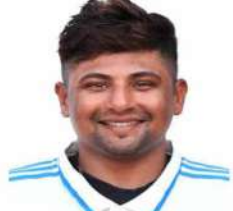
میراٹھین کا خواب بار بار بنتا تھا، حادثاتی طور پر فائر میں گیا، ٹھیکہ 08

The Urdu Daily WATTAN Budgam RNI No. JKURD/2011/37141 قیمت: 02 روپے صفحہ: 08 شمارہ نمبر: 02 جلد: 16