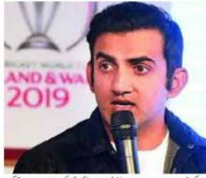
پہلے ہی انہوں نے کہا کہ کھلاڑیوں کو دیانتداری اور شفافیت کے ساتھ سمجھنا چاہیے۔ گمبیر

نیو دہلی (ایم این این)۔ بھارتی کرکٹ کی اہمیت کو دیانتداری اور شفافیت کے ساتھ سمجھنا چاہیے۔ گمبیر نے کہا کہ کھلاڑیوں کو دیانتداری اور شفافیت کے ساتھ سمجھنا چاہیے۔ گمبیر نے کہا کہ کھلاڑیوں کو دیانتداری اور شفافیت کے ساتھ سمجھنا چاہیے۔ گمبیر نے کہا کہ کھلاڑیوں کو دیانتداری اور شفافیت کے ساتھ سمجھنا چاہیے۔