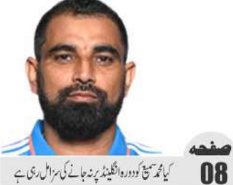
کیا تمہیں کو دورہ انگلینڈ پر جانے کی مزا مل رہی ہے

The Urdu Daily WATTAN Budgam RNI No. JKURD/2011/37141 قیمت: 02 روپے صفحہ: 08 شمارہ نمبر: 264