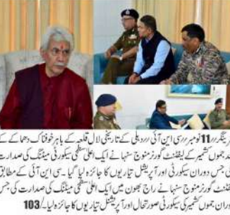
سرینگر 11 نومبر: سرینگر میں اعلیٰ سطحی میٹنگ کے بعد...

دہلی کے تاریخی لال قلعہ کے باہر خوفناک دھماکہ... لیفٹنٹ گورنری صدارت میں سرینگر میں اعلیٰ سطحی میٹنگ... جوں کشمیر کی جمعی سیکورٹی صورتحال اور آپریشن تیار یوں کا جائزہ لیا گیا