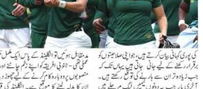
جنوبی افریقہ کی فٹ بال ٹیم نے ایک میچ میں فتح حاصل کی۔

انگلینڈ اور جنوبی افریقہ کے درمیان سخت معرکے کا امکان ہے۔ انہوں نے کہا کہ انگلینڈ اور جنوبی افریقہ کے درمیان سخت معرکے کا امکان ہے۔