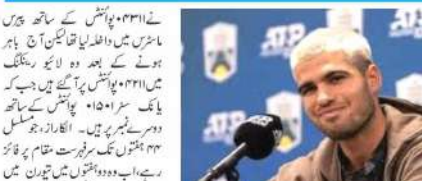
عالمی نمبر ایک الکاراز پیرس ماسٹرس کے دوسرے راؤنڈ میں باہر ہو گیا۔