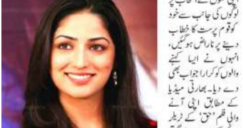
یامی گوتم نے قوم پرست نظریات کا اظہار کیا۔