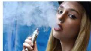
لی بی بی

اس تحریر میں ایسا مواد ہے جو Google YouTube کی جانب سے دیا گیا ہے۔ کسی ایسی چیز کے کوڈ ہونے سے قبل ہم آپ سے اجازت چاہتے ہیں کیونکہ یہ ممکن ہے کہ وہ کوئی مخصوص کوڈ یا ٹیکنالوجی کا استعمال کر رہے ہوں۔ آپ اسے تسلیم کرنے سے پہلے Google YouTube کوئی پالیسی اور پرائیویسی پالیسی پڑھنا چاہیں گے۔ اس مواد کو دیکھنے کے لیے تسلیم کریں، جاری رکھیں، پرکھ کر لیں۔