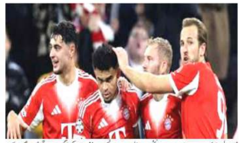
نیو دہلی (ایم این این)۔ بائرن میونخ اور ریل میڈرڈ نے یونینا چیمپئن لیگ میں اپنے اپنے میچ جیت لیے۔ بائرن میونخ نے آرسنل کے خلاف میچ جیت لیا ہے۔