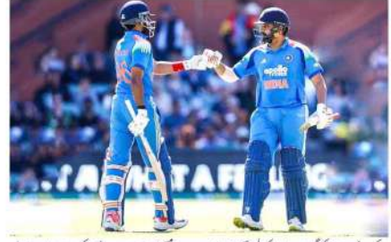
بنا کر پھرتی رہا تا کی گیند پر وراثت کوہلی کے ذریعے سے کچھ کھلا کر پھینک لے، یہیت ریٹن 30 رنز کی آؤٹ کھیل کر کھیل کے آؤٹ ہوئے، جب کہ وراثت کوہلی نے صرف 9 رنز بنائے اور آسٹریلیا نے 28 رنز بنائے۔

نیو دہلی (ایم این این)۔ آسٹریلیا کے خلاف سیریز ہندوستانی ٹیم نے روتھ شرا پٹھن اور اور آسٹریلیا کی ڈیوڈ وارنر کے ساتھ سہارے آسٹریلیا کے خلاف 265 رنز بنا دیے۔ روتھ شرا پٹھن نے 73 رنز اور آسٹریلیا نے 44 رنز کا تعاون کیا۔ جبکہ وراثت کوہلی کا تار دوسرے ٹچ میں سٹریک ہوا تو 2 رنز کے ساتھ آؤٹ ہوئے۔ چھاب میں آسٹریلیا نے پانچ وکٹیں بنائیں اور آسٹریلیا نے 28 رنز بنائے۔ روتھ شرا پٹھن نے 73 رنز اور آسٹریلیا نے 44 رنز کا تعاون کیا۔ جبکہ وراثت کوہلی کا تار دوسرے ٹچ میں سٹریک ہوا تو 2 رنز کے ساتھ آؤٹ ہوئے۔ چھاب میں آسٹریلیا نے پانچ وکٹیں بنائیں اور آسٹریلیا نے 28 رنز بنائے۔