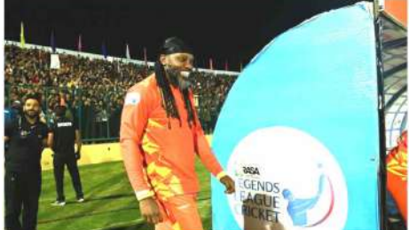
نیو دہلی (ایم این این)۔ سرینگر، سرینگر کی وادی ایک بڑے پیمانے پر کرکٹ کا میلہ منعقد کیا گیا ہے۔

نیو دہلی (ایم این این)۔ سرینگر، سرینگر کی وادی ایک بڑے پیمانے پر کرکٹ کا میلہ منعقد کیا گیا ہے۔ اس میلے میں عالمی اور مقامی کرکٹرز شرکت کریں گے۔