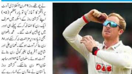
نیو دہلی (ایم این این)۔ جنوبی افریقہ کے کرکٹرز نے ہارمرا ایلیٹ کلب میں داخل ہوئے۔

نیو دہلی (ایم این این)۔ جنوبی افریقہ کے کرکٹرز نے ہارمرا ایلیٹ کلب میں داخل ہوئے۔ اس کلب میں عالمی اور مقامی کرکٹرز شرکت کریں گے۔