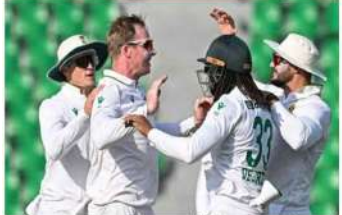
جنوبی افریقہ اور پاکستان کے درمیان ٹیسٹ ٹیسٹ کی سیریز 1-1 سے برابر ہو چکی ہے۔ راولپنڈی میں کھیلے گئے دوسرے اور آخری ٹیسٹ میچ کو مہمان جنوبی افریقہ نے 8 ٹوکوں سے جیت لیا ہے۔ پاکستان کو ٹیسٹ میں آسٹریلیا کے ساتھ ٹیسٹ ٹیسٹ میں 2 (ڈبلیو بی سی) پوائنٹس حاصل میں ہے، جبکہ ہندوستان ٹیم کو اس ٹیسٹ سے ایک مقام کا فائدہ حاصل ہوا ہے۔ جنوبی افریقہ سے پاکستان کو ٹیسٹ میں ڈبلیو بی سی پوائنٹس حاصل میں ہے۔