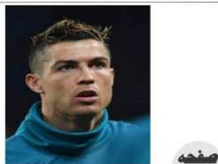
پرنٹنگل کی شاندار فتح، روٹا لڈوے کسی کوچھے چھوڑ دیا

The Urdu Daily WATTAN Budgam RNI No. JKURD/2011/37141