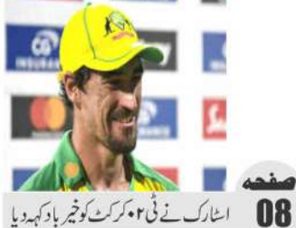
اشٹارک نے ٹی ۲۰ کرکٹ کو شیر باد کہہ دیا 08 صفحہ

لیورپول نے آرسل کے خلاف اینفیلڈ پر تسلط برقرار رکھا 08 صفحہ