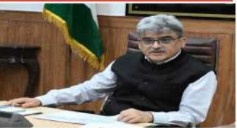
سرگرم 02 ستمبر کو آئی این آر جموں میں سیلاب متاثرہ علاقوں کا دورہ اور متاثرین سے بات چیت کے بعد وزیر داخلہ امیت شاہ واپس دہلی پہنچے اور وہ اب ملک بھر پر وزیر اعظم نریندر مودی کو سیلاب سے ہونے والے نقصان سے آگاہ کریں گے۔