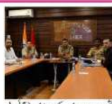
سرگرم 02 ستمبر کو آئی این آر جموں میں سیلاب متاثرہ علاقوں کا دورہ اور متاثرین سے بات چیت کے بعد وزیر داخلہ امیت شاہ واپس دہلی پہنچے اور وہ اب ملک بھر پر وزیر اعظم نریندر مودی کو سیلاب سے ہونے والے نقصان سے آگاہ کریں گے۔