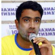
چندرا اشن نے ٹی ٹی ایل سے ریٹائرمنٹ کا اعلان کر دیا

ویشو دیوی لینڈ سٹائلنگ سانچہ مرنے والوں کی تعداد 32 تک پہنچ گئی، درجنوں زخمی