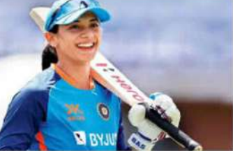
نیپال کرکٹ ٹیم کے سابق کپتان اور کرکٹ کے معروف شخصیات میں سے ایک۔

نی دہلی (ایم ایم این)۔ ہیرا منڈی کی شاندار کامیابی کے بعد بھی کام کا انتظار ہے۔ ادیتی راو حیدری نے کہا کہ وہ اپنی فلموں کے لیے وقف ہو رہی ہیں۔