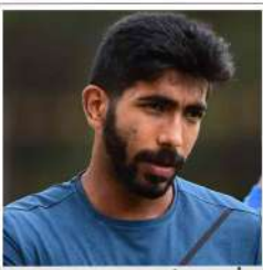
کپتانی سے انکار کر دیا تھا بمبیسر بیت بمرہا

3 جولائی سے شروع ہونے والی 38 روزہ امر ناتھ یا ترا 2025