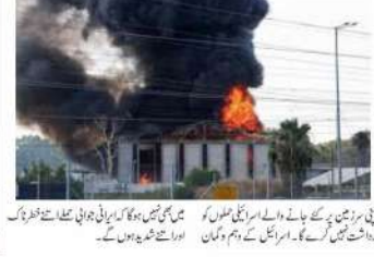
ایران میں موساد کے ہیڈ کوارٹر پر ہونے والی بمباری کی تصویر۔

اسرائیلی ایئر فورس نے ایران کے ایک شہر میں موساد کے ہیڈ کوارٹر پر بمباری کی۔ اس سے دفاعی نظام تباہ ہو گیا۔