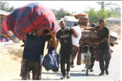
فلسطینی جاں بحق ہونے کے بعد، غزہ کے کئی علاقوں میں نخلہ کی نئی ہدایات جاری کی گئی ہیں۔

غزہ کی نئی ہدایات جاری ہیں۔ اسرائیلی فوج نے غزہ کے کئی علاقوں میں نخلہ کی نئی ہدایات جاری کی ہیں۔ اسرائیلی فوج نے غزہ کے کئی علاقوں میں نخلہ کی نئی ہدایات جاری کی ہیں۔ اسرائیلی فوج نے غزہ کے کئی علاقوں میں نخلہ کی نئی ہدایات جاری کی ہیں۔