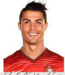
کرسیا نوروناندووی ہم پرننگل اینٹرنیشنل ایک چیمپین

جموں و کشمیر کی سیول انتظامیہ میں بڑے پیمانے پر ردعمل 135 بے کے اے ایس افسران کے تبادلوں اور نئی جگہوں پر تعیناتی کے احکامات کمشنر سکریٹری ایم راجو (آئی اے ایس) کی جانب سے 2 حکومتی حکم نامے جاری