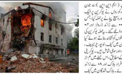
یوکرین میں روسی فوجیوں کے حملے کے نتیجے میں ایک علاقے میں شدید آگ لگی ہے۔

روس کا یوکرین پر مہلک حملہ، یوکرین میں سیکورٹی ہائی الرٹ۔ روس کا یوکرین پر مہلک حملہ، یوکرین میں سیکورٹی ہائی الرٹ۔ روس کا یوکرین پر مہلک حملہ، یوکرین میں سیکورٹی ہائی الرٹ۔