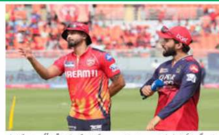
وڈی کیئر بنگلور اور پنجاب کے میچ میں آئی ٹی وی کی تصویریں دکھائی گئیں۔

ٹی وی ڈی (MNN) کی ٹیلی ویژن بنگلور (آری ٹی) اور پنجاب کنگز کے درمیان آئی ٹی وی کے میچ کے دوران ٹی وی کی تصویریں دکھائی گئیں۔