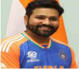
روہت شرما کی ہم وطنوں سے اپیل

امریکہ کی ثالثی میں ایک رات کی بات چیت کے بعد ہندیا پاک نے مکمل اور فوری جنگ بندی پر اتفاق کیا