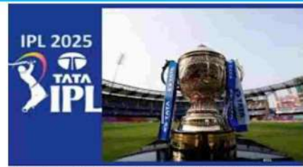
ایس ای این کرک انفو کے مطابق بی سی پی سی آئی نے انڈین پریمیر لیگ کو ایک ہفتے کے لیے معطل کرنے کا فیصلہ کیا ہے۔

بڑھتی کشیدگی اور ترقی یافتہ علاقوں کے بند ہونے کے بعد جہاں بھارت اور بھارتی کھلاڑیوں اور مدعوں کو ملے ہوئے ایک ہفتے کے لیے معطل کرنے کے فیصلے کے بعد اسے آئی بی این کرک انفو کے مطابق بی سی پی سی آئی نے انڈین پریمیر لیگ کو ایک ہفتے کے لیے معطل کرنے کا فیصلہ کیا ہے۔ بھارت اور بھارتی کھلاڑیوں اور مدعوں کو ملے ہوئے ایک ہفتے کے لیے معطل کرنے کے فیصلے کے بعد اسے آئی بی این کرک انفو کے مطابق بی سی پی سی آئی نے انڈین پریمیر لیگ کو ایک ہفتے کے لیے معطل کرنے کا فیصلہ کیا ہے۔