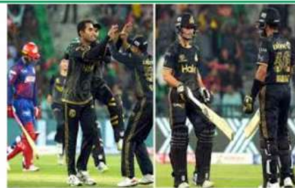
اسلام آباد یونائیٹڈ کے کپتان اور میچنگر محمد حفیظ (دائیں) نے اسلام آباد یونائیٹڈ کے لیے 44 رنز کا ریکارڈ بنایا۔

پاکستان کرکٹ کے سابق کپتان اور پی ایس ایل 10 کے کپتان محمد حفیظ نے اسلام آباد یونائیٹڈ کے لیے 44 رنز کا ریکارڈ بنایا۔ ان کے ساتھ ساتھ اسلام آباد یونائیٹڈ نے پشاورزمی کو 6 وکٹوں سے ہرا دیا۔