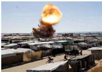
دو ہزاروں افراد کو مزید ہتھیاروں کی ضرورت ہے۔

اسرائیل میں ہونے والے حملوں میں کم از کم ایک ہزار 139 اسرائیلی ہلاک ہوئے تھے، اور 200 سے زائد افراد کو زخمی کیا گیا تھا۔