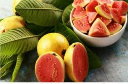
ایسے افراد جو امراض قلب اور معدے کے مختلف بیماریوں کا شکار ہیں انہیں امروہ کا استعمال لازمی کرنا چاہیے۔ ماہرین کے مطابق امروہ پلوٹورہ اپنا اثر کرتا ہے۔

امروہ ایک حیرت انگیز طبی پودہ ہے۔ اس کے پتوں اور پھولوں میں مختلف طبی فوائد ہیں۔ اس کے پتوں اور پھولوں میں مختلف طبی فوائد ہیں۔ اس کے پتوں اور پھولوں میں مختلف طبی فوائد ہیں۔ اس کے پتوں اور پھولوں میں مختلف طبی فوائد ہیں۔ اس کے پتوں اور پھولوں میں مختلف طبی فوائد ہیں۔