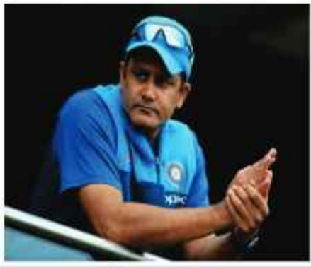
جنوبی افریقی بولنگ سے متعلق انیل کمبلے کا بڑا اعتراف