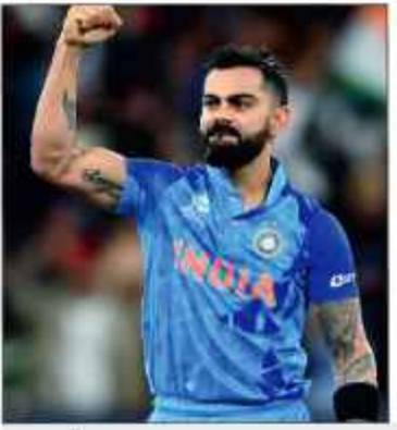
بچن کا 19 سالہ پرانہ ریکارڈ توڑنے کا موقع