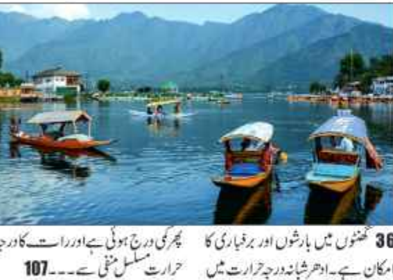
36 گھنٹوں میں بارشوں اور برقیاری کا امکان ہے۔ ادھر شبانہ درجہ حرارت میں

دن کا درجہ حرارت بڑھ گیا لیکن شبانہ سردیوں کا زور مسلسل جاری