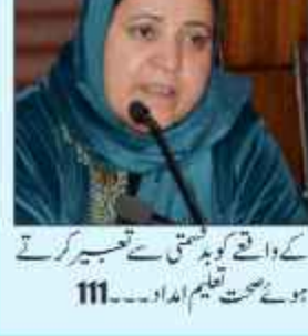
117 افراد کی پر اسرار بیماری سے بلاتک

آئی سی یو میں داخل تین مریض بھی مستحکم چھٹی کا فیصلہ حکومت کرے گی: ہسپتال حکام