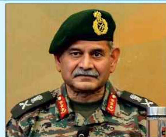
ایچ ڈی ڈی کے مطابق فوج کے سربراہ جنرل ایچ ڈی ڈی نے کہا کہ سرحدوں پر مضبوط سیکورٹی گارڈ کے نتیجے میں دراندازی کے واقعات میں نمایاں کمی آئی ہے۔ انہوں نے کہا کہ پاکستانی فوجیوں کا پارہ چلنے دینے کی کوششوں کو ترک نہیں کرنے گا تو اس کو وہاں نہیں جواسد دیا جسے گا اور ہماری فوج

سری گمر: 15 جنوری 11 جموں و کشمیر کے عوام نے تشدد کو مسترد کیا ہے اور تمام علاقوں میں حالات بہتر ہیں۔ جموں و کشمیر کے سربراہ جنرل ایچ ڈی ڈی نے کہا کہ سرحدوں پر مضبوط سیکورٹی گارڈ کے نتیجے میں دراندازی کے واقعات میں نمایاں کمی آئی ہے۔ انہوں نے کہا کہ پاکستانی فوجیوں کا پارہ چلنے دینے کی کوششوں کو ترک نہیں کرنے گا تو اس کو وہاں نہیں جواسد دیا جسے گا اور ہماری فوج