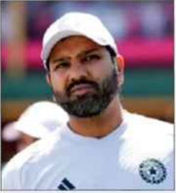
روہت کے دورہ پاکستان کا فیصلہ ہو گیا