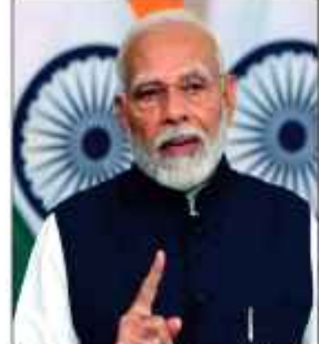
وزیر اعظم نریندر مودی نے فوج کی تعریف کرتے ہوئے کہا کہ ہر ہندوستانی کو ہماری فوج پر فخر ہے۔ انہوں نے مزید کہا کہ فوجیوں نے ہمیشہ ہماری قوم کو محفوظ رکھا ہے اور بحران کے وقت ان کی خدمات کے لئے بڑے پیمانے پر تعریف کی جاتی ہے۔ سی این آئی نے مائیکرو ٹک ڈیک کے مطابق آری ڈے

فوجیوں نے ہمیشہ ہماری قوم کو محفوظ رکھا ہے اور بحران کے وقت ان کی خدمات کے لئے بڑے پیمانے پر تعریف کی جاتی ہے۔ وزیر اعظم مودی نے ایکس پریس کو کہا کہ ہماری فوج پر فخر ہے۔ انہوں نے مزید کہا کہ فوجیوں نے ہمیشہ ہماری قوم کو محفوظ رکھا ہے اور بحران کے وقت ان کی خدمات کے لئے بڑے پیمانے پر تعریف کی جاتی ہے۔ سی این آئی نے مائیکرو ٹک ڈیک کے مطابق آری ڈے