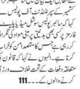
سوشل میڈیا صارفین کیلئے ایڈوائزری جاری غلط مواد کو پوسٹ یا شیئر نہ کریں: سائبر پولیس کشمیر