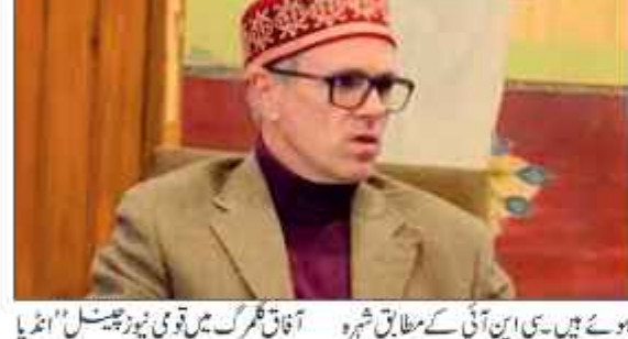
وزیر اعلیٰ عمر عبداللہ نے کہا کہ جموں و کشمیر میں بنیادی ڈھانچے کے منصوبوں کی تکمیل کا دفعہ 370 کی منسوخی سے کوئی تعلق نہیں ہے۔ عمر عبداللہ نے کہا کہ ہم پُر امید، ملازمین کی برطرفی فطری انصاف کے حصول کی خاطر

نوڈے ٹی وی کے ساتھ ایک حواس بات چیت میں وزیر اعلیٰ عمر عبداللہ نے کہا کہ جموں و کشمیر میں بنیادی ڈھانچے کے منصوبوں کی تکمیل کا دفعہ 370 کی منسوخی سے کوئی تعلق نہیں ہے۔ عمر عبداللہ نے کہا کہ ہم پُر امید، ملازمین کی برطرفی فطری انصاف کے حصول کی خاطر