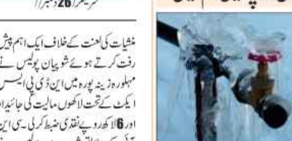
سرینگر 26 دسمبر // چلہ کلان میں سخت ترین سردی اور شبانہ درجہ حرارت میں کمی۔ شہر سرینگر سمیت وادی کے دیگر علاقوں میں پانی کے لٹل اور پائپس جھم گئیں۔

شہر سرینگر سمیت وادی کے دیگر علاقوں میں پانی کے لٹل اور پائپس جھم گئیں