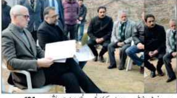
وزیر اعلیٰ عمر عبداللہ نے جمعرات کو کوئی وفد سے ملاقات کی اور سماج کے مختلف شعبوں کو درپیش چیلنجوں سے نمٹنے کے لیے اعلیٰ حکومت کے محکمات پر زور دیا۔ وزیر اعلیٰ نے یہ بات بیہاں رابطہ دفتر میں اپنے عوامی رابطہ پروگرام کے دوران کہی، جہاں کشمیر کے مختلف محلوں سے آئے ہوئے سینکڑوں وفدوں اور افراد نے اپنے تعلقات اور مطالبات پیش کیے۔

لوگوں کے مسائل پر فوری توجہ کی ضرورت اور ترجیحی بنیادوں پر حل کرنا ہماری سرکار کا عزم: وزیر اعلیٰ عمر عبداللہ