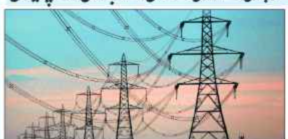
میں اہلیان وادی کو پریشان کن صورتحال کا سامنا ہے۔ سرینگر 26 دسمبر //

شدت کی سردی میں بجلی کی آنکھ چھوٹی سے وادی کے شمال و جنوب میں لوگ پریشان