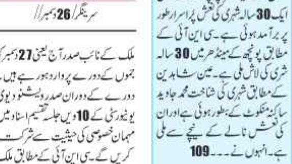
سرینگر 26 دسمبر // ملک کے نائب صدر آج جموں دورے پر وارد ہونگے۔ انہوں نے کہا کہ انہوں نے اپنے دورے کے دوران ویشنو پوری یونیورسٹی کے جلسہ تقسیم اسناد میں مہمان خصوصی کے بطور شرکت کریں گے۔

ویشنو پوری یونیورسٹی کے جلسہ تقسیم اسناد میں مہمان خصوصی کے بطور شرکت کریں گے