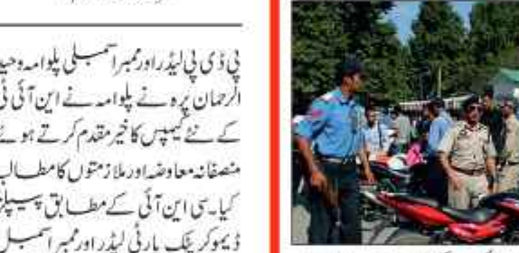
سرینگر 26 دسمبر // ٹریفک قوانین کی خلاف ورزی کرنے کی پاداش میں ٹریفک ٹولے نے جنوبی ضلع انتہا ناگ میں جنوری 2024 سے اب تک 2 کروڑ 40 لاکھ سے زائد جرمانہ وصول کیا ہے۔

انتہا ناگ میں جنوری 2024 سے اب تک 2 کروڑ 40 لاکھ سے زائد جرمانہ وصول