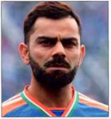
کمانی کی ناپ پوزیشن چھن گئی

پونچھ میں ملی ٹنٹوں کی کیمین گاہ تباہ، اسلحہ برآمد