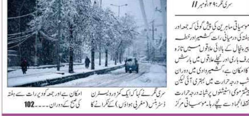
سری نگر: 29 نومبر 11

تازہ ہر فباری اور بارشوں کا قوی امکان، 2 سے 3 ڈگری تک پھر برف و باران