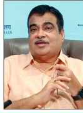
انہم قومی شاہراہوں کے ساتھ واقع کئی ٹول پلازوں سے ٹول آمدنی حاصل کی گئی ہے۔ انہوں نے کہا کہ ایس ڈی جی پی آئنڈ جین نے کہا کہ شہری چوکس رہیں اور کسی بھی مشکوک سرگرمی کی اطلاع دے کر قانون نافذ کرنے والے اداروں کے ساتھ...

شاہراہوں کی کل تعمیری لاگت 13,813.42 کروڑ روپے تک پہنچ گئی: گڈ کری