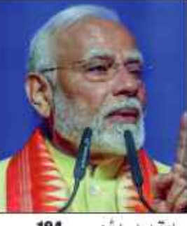
ریاستوں اور یونٹوں...

اڈیشہ میں تین روزہ آل انڈیا ڈی جی پیز اور آئی جی پیز کانفرنس کی باضابطہ طور پر شروعات