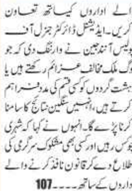
اداروں کے ساتھ...

شہری چوکس رہیں، مشکوک سرگرمی کی اطلاع دیں: ایس ڈی جی پی آئنڈ جین