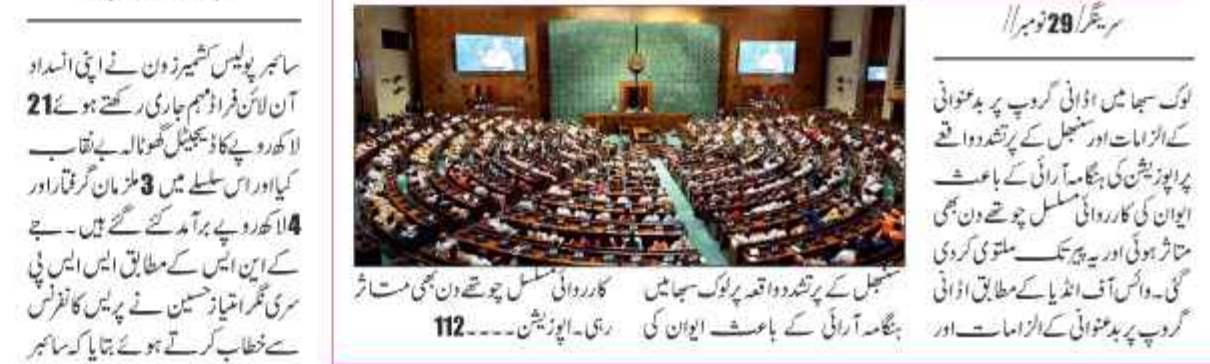
لوک سبھا میں اڈوائی گروپ پر ہمتوانی کے الزامات اور سنجنھل کے پرتشدد واقعے پر اپوزیشن کی کارروائی کی باعزت ایوان کی متاثر ہوئی اور یہ پرتشدد ملتوی کر دی گئی۔ واہس آف انڈیا کے مطابق اڈوائی گروپ پر ہمتوانی کے الزامات اور...

اڈوائی اور سنجنھل معاملات پر اپوزیشن کا احتجاج، لوک سبھا کی کارروائی پیر تک ملتوی