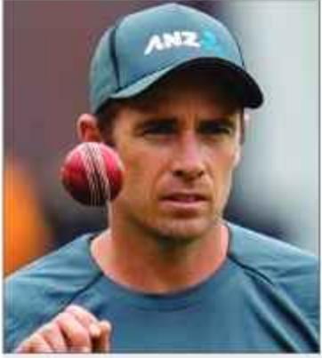
ٹیڈ کرکٹ سے ریٹائرمنٹ لیں گے