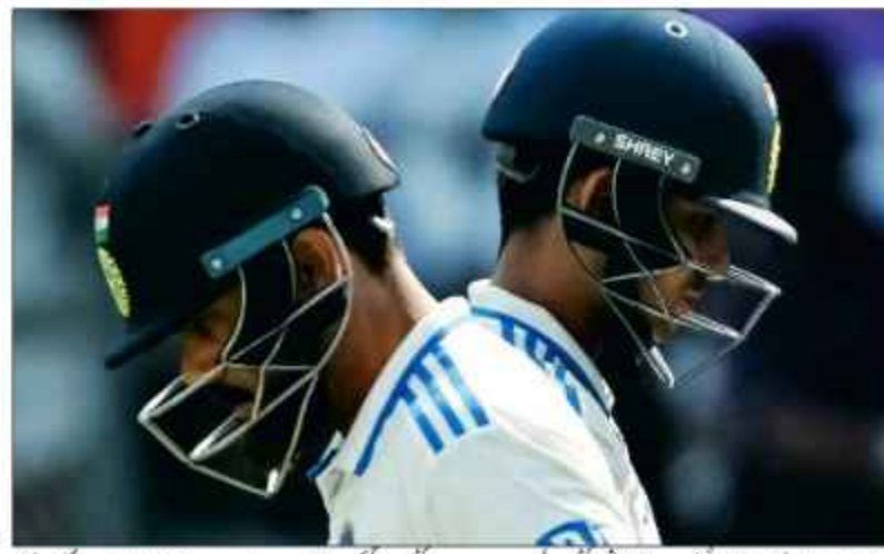
نیوزی لینڈ کے کپتان کیپٹن نے پانچ ٹیسٹوں میں ایک بھی ٹیسٹ نہیں ہارے اور انڈیا کو ہوم گراؤنڈ پر ٹیسٹ سیریز میں تاریخی وائٹ واش کرنے کے بعد انڈیا کے سابق کپتان مگن کی سوچوں اور کھلاڑیوں کی کارکردگی پر حیرت دہانی دہاں ہے۔

نیوزی لینڈ کی جانب سے انڈیا کو ہوم گراؤنڈ پر ٹیسٹ سیریز میں تاریخی وائٹ واش کرنے کے بعد انڈیا کے سابق کپتان مگن کی سوچوں اور کھلاڑیوں کی کارکردگی پر حیرت دہانی دہاں ہے۔ سیریز میں تین سو سے زائد ٹیسٹ کے بعد انڈیا کے سابق کپتان مگن کی سوچوں اور کھلاڑیوں کی کارکردگی پر حیرت دہانی دہاں ہے۔