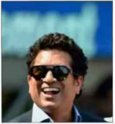
پہن کاریکار ڈکونٹی کی دسترس میں آگیا