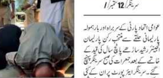
عوامی اتحاد پارٹی کے سربراہ اور پارلیمنٹ پارلیمانی طبقے سے منتخب رکن پارلیمنٹ انجینئر رشید سارا سے پانچ سال کی قید کے خاتمے کے بعد جمہوریت کی حق سرینگر پہنچ گئے۔ سرینگر ایئر پورٹ پر ان کے کئی کارکن موجود تھے۔ انجینئر رشید جو بھی شہر کے عالم انٹرنیشنل ایئر پورٹ سے باہر آئے تو انہوں نے سڑک پر سجدہ کیا اور جب سے

سرینگر 12/ ستمبر 11 عوامی اتحاد پارٹی کے سربراہ اور پارلیمنٹ پارلیمانی طبقے سے منتخب رکن پارلیمنٹ انجینئر رشید سارا سے پانچ سال کی قید کے خاتمے کے بعد جمہوریت کی حق سرینگر پہنچ گئے۔ سرینگر ایئر پورٹ پر ان کے کئی کارکن موجود تھے۔ انجینئر رشید جو بھی شہر کے عالم انٹرنیشنل ایئر پورٹ سے باہر آئے تو انہوں نے سڑک پر سجدہ کیا اور جب سے