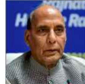
ہندوستان کا مقصد متحد ہونا، دیگر اقوام کے ساتھ مل کر آگے بڑھنا: راجناتھ

سرینگر 12/ ستمبر 11 آج دنیا میں ایک دوسرے سے آگے نکلنے کی دوڑ لگی ہوئی ہے، ملکوں کے درمیان مختلف ٹیکنالوجیوں پر جنگیں جاری ہیں کی بات کرتے ہوئے وزیر دفاع راجناتھ نے کہا کہ اس بات پر یقین رکھنا چاہیے کہ ہندوستان کا مقصد متحد ہونا اور دیگر اقوام کے ساتھ مل کر آگے بڑھنا ہے۔ انہوں نے دوست ممالک