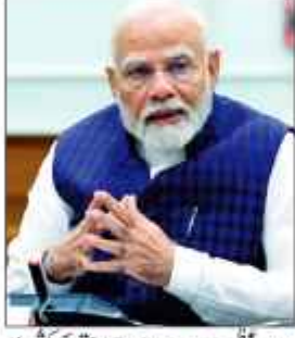
وزیر اعلیٰ مودی 19 ستمبر کو شیر کشمیر سے خطاب کرنے کی...

19 ستمبر کو وزیر اعلیٰ مودی کا دورہ سرینگر سے شیر کشمیر اسٹیڈیم میں عوامی ریلی سے خطاب کریں گے سرینگر 12/ ستمبر 11 جسٹس کشمیر میں اسمبلی انتخابات کے پیش نظر وزیر اعلیٰ مودی کا 18 ستمبر کو دورہ سرینگر پر وارد ہو رہا ہے جس دوران وہ شیر کشمیر اسٹیڈیم میں ایک عوامی ریلی سے خطاب کریں گے۔ سی این آئی کے مطابق جسٹس کشمیر کے اسمبلی انتخابات کے پیش نظر سرینگر میں گزشتہ دنوں سے تباہی مچا رہی ہے۔