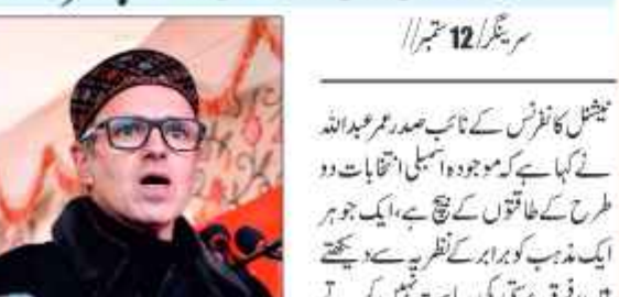
پیش کشی کے فرائض کے نائب صدر عمر عبداللہ نے کہا ہے کہ موجودہ اسمبلی انتخابات دو طرح کے طاقتوں کے تقابلی ہیں، ایک جو ہر ایک مذہب کو برابر کے نظریے سے دیکھتا ہے، فرقہ پرستی کی سیاست نہیں کرتے ہیں اور لوگوں کو مذہب کے خیموں میں بند کرنے کے بجائے انہیں مل جل کر بننے کے لیے اور دوسری طرف

سرینگر 12/ ستمبر 11 پیش کشی کے فرائض کے نائب صدر عمر عبداللہ نے کہا ہے کہ موجودہ اسمبلی انتخابات دو طرح کے طاقتوں کے تقابلی ہیں، ایک جو ہر ایک مذہب کو برابر کے نظریے سے دیکھتا ہے، فرقہ پرستی کی سیاست نہیں کرتے ہیں اور لوگوں کو مذہب کے خیموں میں بند کرنے کے بجائے انہیں مل جل کر بننے کے لیے اور دوسری طرف