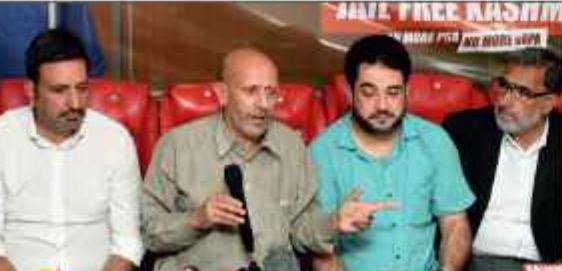
میں تو وزیر اعظم کے باہر دھرنا دیں گے اور کشمیریوں کیلئے ناقابل تصور کچھ کریں گے۔ انہوں نے مزید کہا کہ 5 سال تہاڑ اور کچھ دن ایس کے آئی سی سی میں گزارنے میں بڑا فرق ہے۔ سی این آئی کے مطابق سرینگر میں ایک پریس کانفرنس سے خطاب کرتے ہوئے عوامی اتحاد پارٹی کے سربراہ اور مسیبر پارلیمنٹ برائے بارہول انجینئر رشید نے کہا "مجھے یہ واضح... 104

سرینگر 12/ ستمبر 11 اعلیٰ ایجنسی کے ساتھ لوگ سماں دفعہ 370 کی حمایت کے بارے میں قرارداد پیش کرنے کی یقین دہانی کرائے تو ان کی حمایت کروں گا کا اعلان کرتے ہوئے ممبر پارلیمنٹ انجینئر رشید نے کہا کہ اگر اسمبلی انتخابات کے دوران 40 سیٹیں