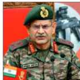
افسران کے سربراہ بنگالی دورے پر سرینگر وار ہو رہے ہیں۔ 108

سرینگر 12/ ستمبر 11 ساج سے نئیات کی صنعت کو ختم کرنے کی خواہش کو پیش نظر پولیس نے وادی بھر میں نئیات فروشوں کے خلاف سلسلہ وار کارروائیاں کیں جس کے نتیجے میں 11 نئیات فروشوں کو گرفتار کیا گیا اور ان کے قبضے سے بھاری مقدار میں ممنوعہ اشیاء برآمد کی گئیں۔ سی این آئی کے مطابق لوگوں میں پولیس نے 109