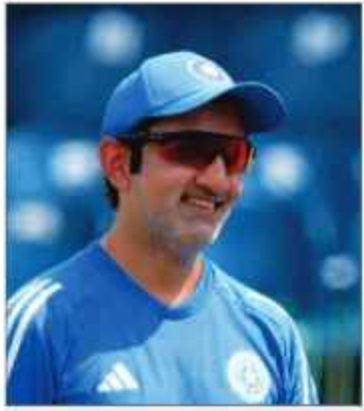
کوئٹہ میں آج بھی رنوں کی بھونک