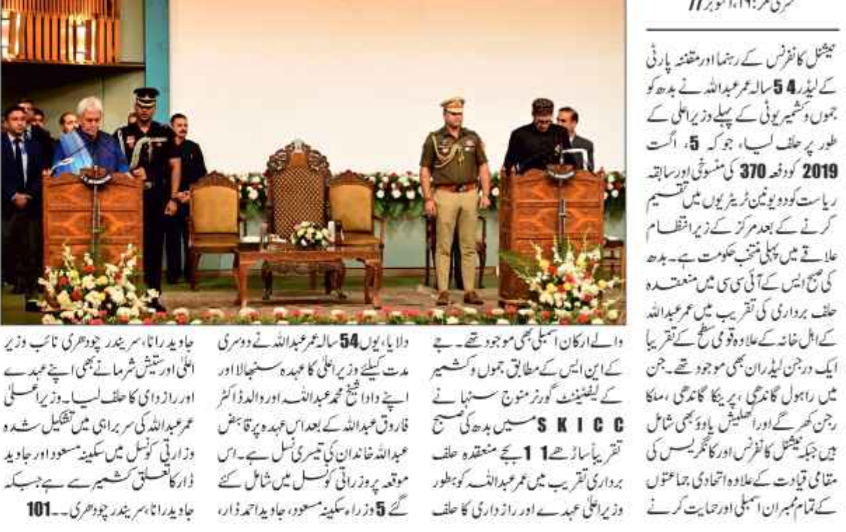
سری نگر، 17 اکتوبر 11

جیشل کانفرنس کے رہنما اور متفقہ پارٹی کے لیڈر 54 سالہ عمر عبداللہ نے بدھ کو جموں و کشمیر یونٹی کے پہلے وزیر اعلیٰ کے طور پر حلف لیا۔ جو کہ 5 اگست 2019 کو دلایا گیا تھا۔ 370 نشستوں اور سابق ریاست کوڈ پور میں ٹریڈ یونٹوں میں تقسیم کرنے کے بعد مرکز کے زیر اہتمام علاقے میں پہلی منتخب حکومت ہے۔ بدھ کی صبح ایش کے آئی سی سی میں منعقدہ حلف برداری کی تقریب میں عمر عبداللہ کے اہل خانہ کے علاوہ قومی سطح کے تقریباً ایک درجن لیڈران بھی موجود تھے۔ جن میں راجول گاگرھی، پریکا گاگرھی، سماکا راجن کھرے اور ایشلیس یادو بھی شامل ہیں جبکہ جیشل کانفرنس اور کانگریس کی مقامی قیادت کے علاوہ اتحادی جماعتوں کے تمام ممبران اسمبلی اور صیانت کرنے والے ارکان اسمبلی بھی موجود تھے۔