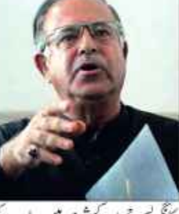
کانگریس جموں و کشمیر میں ریاست کی بحالی کے لیے لڑتی۔۔۔ 107

کانگریس نے بدھ کے روز کہا کہ اس نئی تشکیل شدہ جموں و کشمیر حکومت میں وزراء کی کونسل میں شامل نہ ہونے کا فیصلہ کیا ہے کیونکہ پارٹی ناخوش ہے کہ مرکز کے زیر انتظام علاقے کو ریاست کا درجہ بحال نہیں کیا گیا تھا۔ جس کے این ایش کے مطابق ایک بیان میں، جموں و کشمیر پریڈیشن کانگریس کمیٹی کے