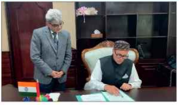
وزیر اعلیٰ عمر عبداللہ نے بدھ کے روز اس امید کا اظہار کیا کہ جموں و کشمیر زیادہ دیر تک مرکز کے زیر انتظام نہیں رہے گا اور جلد ہی مکمل ریاست کا درجہ حاصل کر لے گا۔ جس کے این ایش کے مطابق سابق وزیر اعلیٰ اپنے عہدے کا حلف دیا۔۔۔ 101