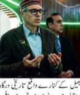
جموں و کشمیر کے نامزد وزیر اعلیٰ عمر عبداللہ نے بدھ کو اپنی حلف برداری سے قبل یہاں درگاہ حضرت بل میں حاضری دی اور مرکز کے زیر انتظام علاقے کے امن اور خوشحالی کے لیے دعا کی۔ جس کے این ایش کے مطابق عمر عبداللہ، جنہوں نے جموں و کشمیر کے مرکزی علاقے کے پہلے وزیر اعلیٰ کے طور پر حلف اٹھا یا، نے حلف برداری سے قبل یہاں کی مشہور اول