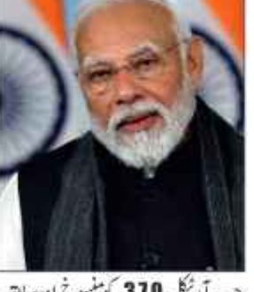
جب آرٹیکل 370 کو منسوخ اور سابق ریاست جموں و کشمیر کو ڈویژن ٹریڈ یونٹوں میں تقسیم کیا گیا تھا، مرکز کے زیر اہتمام علاقے میں پہلی منتخب حکومت ہے۔ جس کے این ایش کے مطابق سماجی رابطہ گاہ و اینس کے پوسٹ میں وزیر اعلیٰ عمر عبداللہ نے کہا کہ 'جناب عمر عبداللہ، جموں و کشمیر کے وزیر اعلیٰ کے طور پر حلف لینے پر مبارکباد۔ جو اس کی خدمت کیلئے ان کی کوششوں میں ان کے لئے نیک خواہشات کا اظہار۔۔۔ 102

وزیر اعلیٰ عمر عبداللہ نے بدھ کو مسٹر عبداللہ کو جموں و کشمیر کے وزیر اعلیٰ کے طور پر حلف لینے پر مبارکباد دی اور کہا کہ مرکز جموں و کشمیر کی ترقی کیلئے ان کے اور ان کی ٹیم کیساتھ مسلسل کام کرے گا۔ جیشل کانفرنس کے رہنما عمر عبداللہ نے بدھ کے روز جموں اور کشمیر کے وزیر اعلیٰ کے طور پر حلف لیا۔ 2019 کے بعد ریاست جموں و کشمیر کو ڈویژن ٹریڈ یونٹوں میں تقسیم کیا گیا تھا، مرکز کے زیر اہتمام علاقے میں پہلی منتخب حکومت ہے۔ جس کے این ایش کے مطابق سماجی رابطہ گاہ و اینس کے پوسٹ میں وزیر اعلیٰ عمر عبداللہ نے کہا کہ 'جناب عمر عبداللہ، جموں و کشمیر کے وزیر اعلیٰ کے طور پر حلف لینے پر مبارکباد۔ جو اس کی خدمت کیلئے ان کی کوششوں میں ان کے لئے نیک خواہشات کا اظہار۔۔۔ 102