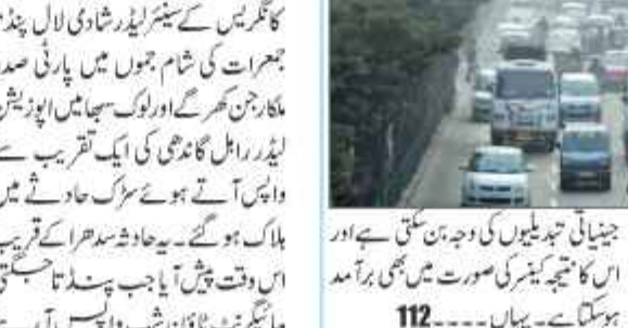
سرینگر 23 اگست // ماحولیاتی آلودگی سے آکسیجن متاثر ہونے کا اندیشہ ہے۔

آلودہ ہوا میں تین سال کے عرصے میں پھیپھڑوں کے سرطان کا خطرہ بڑھتا ہے