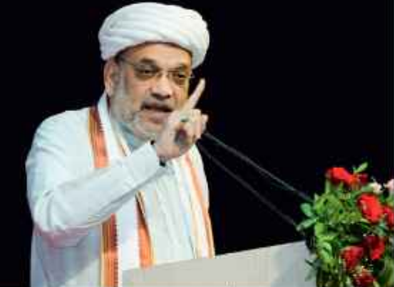
سرینگر 23 اگست // مرکزی وزیر داخلہ امت شاہ نے ہندوستان کے مودی کی قیادت والی حکومت کے آرٹیکل 370 اور 35A کی منسوخی کے بعد انہیں تحفظات دے کر پسماندہ گروہوں بشمول دلتوں، قسبائیوں، پہاڑیوں اور پسماندہ طبقات کے خلاف برسوں سے جاری امتیازی سلوک کو ختم کرنے کی ضرورت پر زور دیا۔

امتیازی سلوک کو ختم کرنے کے لیے مودی حکومت نے پسماندہ لوگوں اور طبقوں کے خلاف برسوں سے جاری امتیازی سلوک کو ختم کرنے کی ضرورت پر زور دیا۔