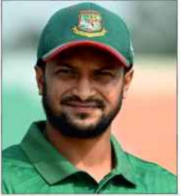
کرکٹر شکیب الحسن پر قتل کا مقدمہ درج