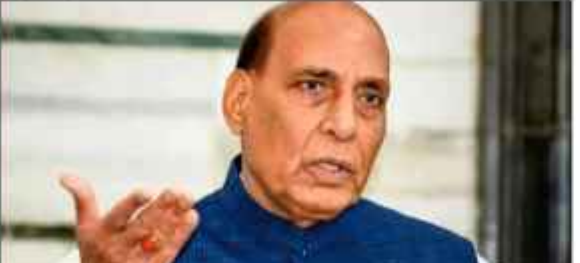
سرینگر 23 اگست // ہندوستان اور امریکہ کے عالمی اسٹاک اور خوشحالی کو یقینی بنانے میں کامیاب ہوئے۔ وزیر دفاع راج ناتھ سنگھ نے کہا کہ ہندوستان 2027 تک تیسری سب سے بڑی معیشت بن جائے گا۔ انہوں نے اس شخصیت کو اجاگر کیا کہ حکومت نے کامیابی کے ساتھ 25 کروڑ لوگوں کو غربت کی لکیر سے اوپر لایا ہے۔

مودی حکومت نے کامیابی کے ساتھ 25 کروڑ لوگوں کو غربت کی لکیر سے اوپر لایا