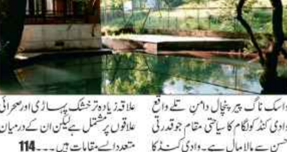
سرینگر 23 اگست // واسک ناگ کا سیاحتی مقام سیاحتی نقشے سے اوجھل ہے۔

علاقے کو سیاحتی مقام کے طور پر ترقی دینے سے مقامی نوجوانوں کو روزگار میسر ہوگا