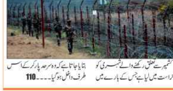
سرینگر 23 اگست // فوج نے پونچھ میں کنٹرول لائن کے قریب پاکستانی شہری گرفتار کیا۔

کٹھنہ میں مشکوک افراد کی نقل و حرکت کی اطلاعات ملنے پر تلاشی آپریشن شروع