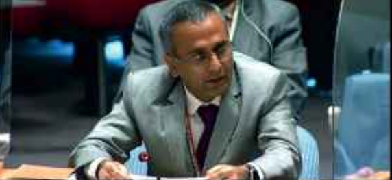
سرینگر 23 اگست // آرویندر کپورہ نے کہا کہ دہشت گردی اور انتہا پسندی کو ایک مرتبہ پھر عالمی خطرہ قرار دینے کے لیے اقوام متحدہ میں بھارت کے مستقل نمائندے نے کہا کہ انتہا پسندی اور دہشت گردی کیلئے ایک جامع نقطہ نظر کو اپنایا جائے۔

آرویندر کپورہ نے کہا کہ دہشت گردی اور انتہا پسندی کو ایک مرتبہ پھر عالمی خطرہ قرار دینے کے لیے اقوام متحدہ میں بھارت کے مستقل نمائندے نے کہا کہ انتہا پسندی اور دہشت گردی کیلئے ایک جامع نقطہ نظر کو اپنایا جائے۔