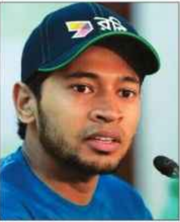
اسلام آباد پہلی بار آیا ہوں، سہولتیں اچھی ہیں