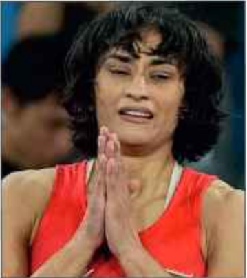
پھوگاٹ نے ریٹائرمنٹ کا اعلان کیا