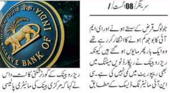
ریزرو بینک نے 9 ویں بار ریپوریٹ میں نہیں کی کوئی کمی

ایم ایم آئی نہیں ہوگی کم قرض کا بوجھ رکھنے والے افراد پھر مایوس۔ ریزرو بینک نے 9 ویں بار ریپوریٹ میں نہیں کی کوئی کمی۔