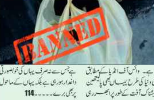
پلاسٹک اور پالیٹھین کے بے تحاشہ استعمال سے یہاں کی زمین بالکل خراب ہو چکی

پلاسٹک اور پالیٹھین کے بے تحاشہ استعمال سے یہاں کی زمین بالکل خراب ہو چکی۔ پلاسٹک اور پالیٹھین کے بے تحاشہ استعمال سے یہاں کی زمین بالکل خراب ہو چکی۔