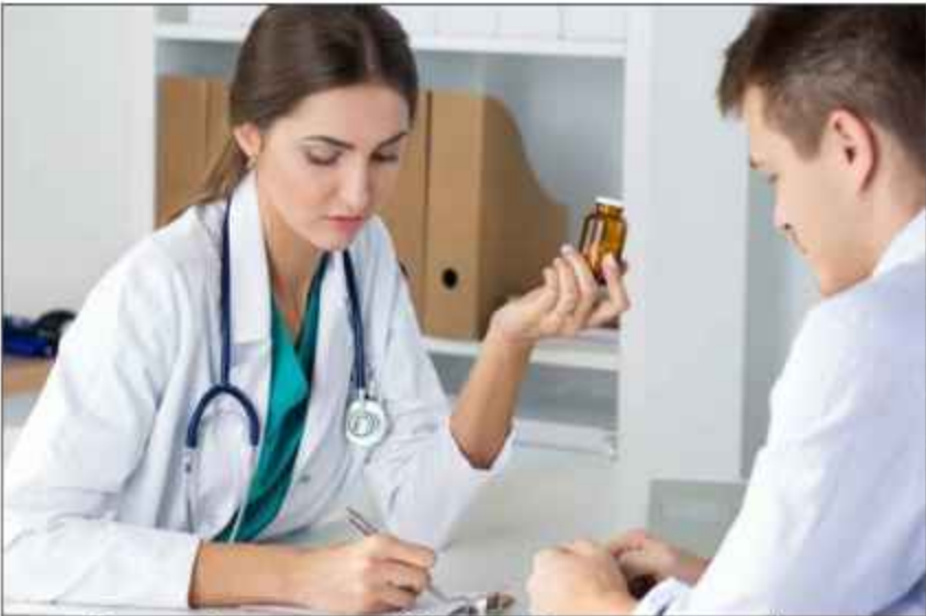
اہم وجہ تھوڑا اور ذہنی صحت کے مسائل ہیں۔ نوجوان اضطراب، تناؤ اور ڈپریشن کا شکار نظر آتی ہے اور اس طرح کے دیگر ذہنی تندرستی کے مسائل سے نمٹنے کے لیے نوجوانوں کو مستقل طور پر اس کی طرف مائل کرنا ہے۔

بہت سے سببوں سے منشیات کا استعمال اور ذہنی صحت کے مسائل کا تعلق ہے۔ منشیات کا استعمال اور ذہنی صحت کے مسائل کا تعلق ہے۔ منشیات کا استعمال اور ذہنی صحت کے مسائل کا تعلق ہے۔ منشیات کا استعمال اور ذہنی صحت کے مسائل کا تعلق ہے۔