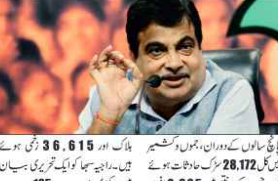
پانچ سالوں کے دوران، جموں و کشمیر میں کل 28,172 سڑک حادثات ہوئے

جموں و کشمیر میں 5 سالوں میں 28172 سڑک حادثات رونما ہوئے۔ روڈ سیفٹی سے متعلق ہر سال پیش رو سیفٹی مہینہ یا ہفتہ منایا جاتا ہے۔