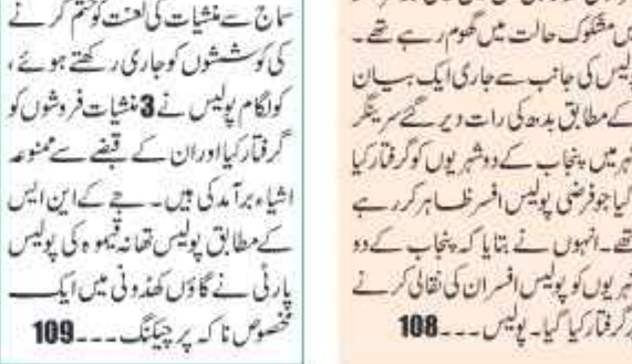
پنجاب سے تعلق رکھنے والے دو جعلی پولیس افسر گرفتار

نہرو پارک سرینگر میں پولیس کی بڑی کارروائی۔ پنجاب سے تعلق رکھنے والے دو جعلی پولیس افسر گرفتار۔