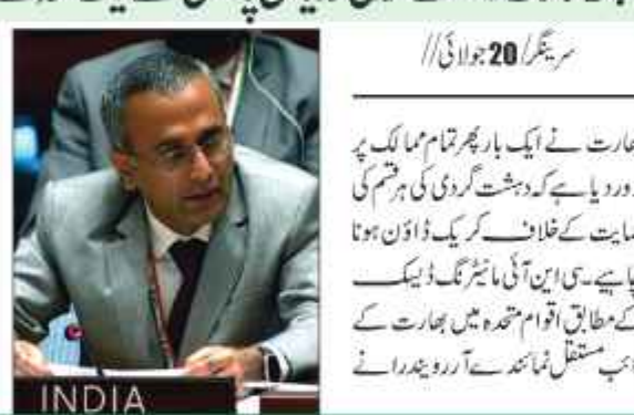
دہشت گردی کی مختلف دوہرے معیلات سے پرہیز کریں

دہشت گردی کی مختلف دوہرے معیلات سے پرہیز کریں۔ انہوں نے علاقے کی سیکورٹی صورتحال کا جائزہ لیا اور فوجی دستوں کی تعیناتی کے بارے میں فیصلے کیے۔