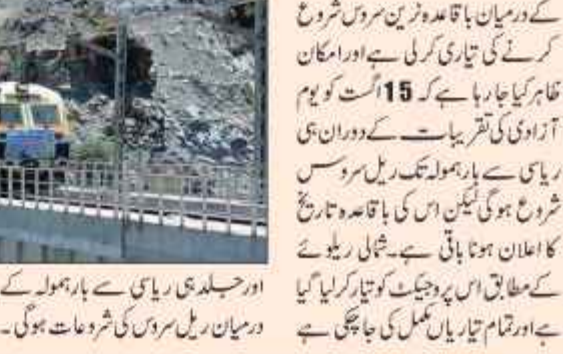
ریاست سے براہ راست بارہمولہ تک ریل سروس چلانے کیلئے

مکمل طور پر 15 اگست کو اس پروجیکٹ کو بری جھنڈی دکھا کر شروع کیا جائے گا، حتمی اعلان ہونے پر