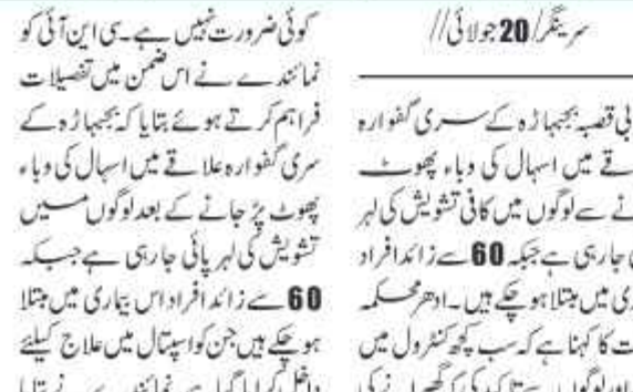
سرگھوڑہ نجیہاڑہ میں اسپتال کی وباء پھوٹ پڑنے سے

سرگھوڑہ نجیہاڑہ میں اسپتال کی وباء پھوٹ پڑنے سے لوگوں میں کافی تشویش، 60 سے زائد افراد بیماری میں مبتلا، محکمہ صحت متحرک۔ انہوں نے علاقے کی سیکورٹی صورتحال کا جائزہ لیا اور فوجی دستوں کی تعیناتی کے بارے میں فیصلے کیے۔