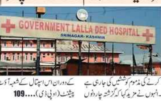
وادی کشمیر کے سب سے بڑے زچہ بچہ اسپتال

"دل دید" مریضوں کو بہتر سہولیات برہم رکھنے کے لئے پرعزم