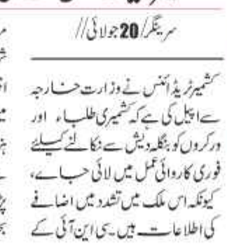
بنگلہ دیش میں زیر تعلیم طلباء کے والدین پریشان

بنگلہ دیش میں زیر تعلیم طلباء کے والدین پریشان۔ انہوں نے علاقے کی سیکورٹی صورتحال کا جائزہ لیا اور فوجی دستوں کی تعیناتی کے بارے میں فیصلے کیے۔