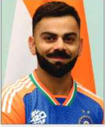
کوئٹی نے ٹیم سلیکشن میں تعصب برتنا