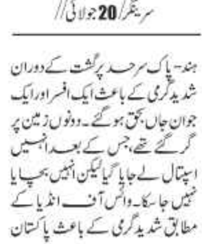
ہندیاک سرحد پر گشت کرنے والے

ہندیاک سرحد پر گشت کرنے والے بی ایس ایف کے افسر اور جوان حبال بحق۔ انہوں نے علاقے کی سیکورٹی صورتحال کا جائزہ لیا اور فوجی دستوں کی تعیناتی کے بارے میں فیصلے کیے۔