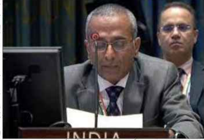
تمام برطانویوں کی فوری اور خیر مشروط رہائی کا بھی مطالبہ کرتے ہیں۔ انہوں نے اسرائیل اور فلسطین کی قیادت کے ساتھ مسلسل رابطے میں تھیں اور مصری ممبرانہ لک کے کردار کو بھی سراہا۔ انہوں نے مزید کہا کہ "ہم نے تمام مختلف تہذیبی فرقہ پر مسلح اپنے موقف کا اعلان کیا ہے۔ ہندوستان غلطی میں اس اور اتحاد کے لیے کھڑا ہے۔ ہم یوروپین موقف رہا ہے کہ ہم دور ریاستی عمل کی حمایت کرتے ہیں جس میں مسلم غرہ اور باہمی طور پر متفقہ سرحدوں کے اندر فلسطین کی ایک خود مختار قابل عمل اور خود مختار ریاست کا قیام شامل ہے۔ جو اسرائیل کے ساتھ امن کے

بھارتی تیل کمپنیوں کی 40.6 بلین ڈالر کی خاص سرمایہ کاری کے ساتھ عالمی 21 ممالک میں موجودگی ہے/سردیپ پوری نیویارک // اقوام متحدہ میں ہندوستان نے غرہ کی پٹی میں فوری اور مکمل جنگ بندی کے مطالبے کا اعلان کیا ہے اور یہ مطالبہ کسی بھی صورت میں ہٹانے کا مطالبہ کیا ہے۔ پورے اقوام متحدہ کی سلامتی کونسل (یو این ایس سی) کے مشرق وسطیٰ پر خطے میں ہندوستان کے نائب نمائندے نے آج پندرہ دنوں کی اس بات پر زور دیا کہ فلسطین کے لیے ہندوستان کی ترقیاتی امداد بھی سالوں میں مختلف شکلوں میں، 120 ملین امریکی ڈالر کے قریب ہے۔ ہندوستان ان ممالک میں شامل تھا جنہوں نے 17 اگست 2023 کو اسرائیل پر ہونے والے دہشت گرد حملوں کی سختی اور واضح طور پر مذمت کی تھی۔ ہم نے اسرائیل اور حماس کے جاری تنازعہ میں شریلی کی جانوں کے ضیاع کی بھی مذمت کی ہے۔ ہم نے حملے کی کوکھ کرنے اور زور دیا ہے بات چیت اور سفارت کاری کے ذریعے تنازعات کا پورا کرنا اور بین الاقوامی قانون اور بین الاقوامی انسانی قانون کی پاسداری پر زور دیا۔ آج روپوش ہونے کے لیے ہم غرہ کی پٹی میں فوری اور مکمل جنگ بندی، محفوظ بر وقت اور پائیدار انسانی امداد اور طبی اور ضروری انسانی خدمات تک خیرہودہ دہشت گردوں کے مطالبے کا اعلان کرتے ہیں۔ اس کے علاوہ ہم