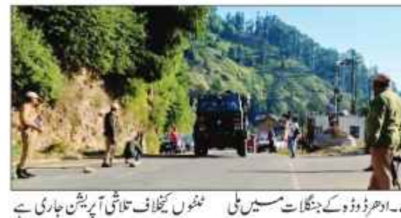
جموں کے مختلف علاقوں میں ملی ٹنٹ حملوں کے بعد سیکورٹی فورسز کی نئی حکمت عملی

جموں کے مختلف علاقوں میں ملی ٹنٹ حملوں کے بعد سیکورٹی فورسز کی نئی حکمت عملی۔ انہوں نے علاقے کی سیکورٹی صورتحال کا جائزہ لیا اور فوجی دستوں کی تعیناتی کے بارے میں فیصلے کیے۔