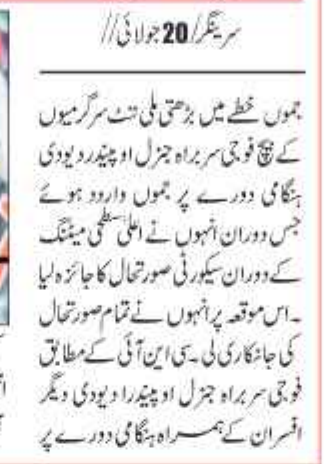
لیفٹنٹ جنرل اوپیندر پوڈی

جموں خطے میں بڑھتے حملوں کے بعد سیکورٹی صورتحال کا تفصیلی جائزہ لیا۔ لیفٹنٹ جنرل اوپیندر پوڈی ہنگامی دورے پر جموں وارد ہوئے۔ انہوں نے علاقے کی سیکورٹی صورتحال کا جائزہ لیا اور فوجی دستوں کی تعیناتی کے بارے میں فیصلے کیے۔