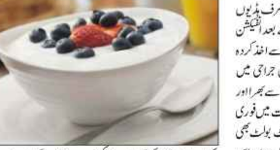
بیکٹیریا یا اس کا کم آسان بنا سکتی ہے۔ جین کے ماہرین نے یہ بیکٹیریا دریافت کیا ہے۔ یعنی شروہان میں واقع ہویا پانی یونیورسٹی

دوہان: دہی میں بعض بیکٹیریا دریافت ہوئے ہیں جو صرف ہڈیوں کے فریکچر کو تیزی سے مندمل کرتے ہیں۔ بلکہ آپریشن کے بعد انفیکشن اور پیچیدگیوں کو بھی کم کر سکتے ہیں۔ تجرباتی طور پر دہی سے اخذ کردہ ایک قسم کے جڑوں سے کوئلہ کر کے جب ٹوٹی ہڈیوں کی جراحی میں استعمال کیا گیا تو اس سے بہت فائدہ ہوا کیونکہ ڈم تیزی سے بھرا اور انفیکشن میں کمی واقع ہوئی۔ فریکچر اور ہڈی ٹوٹنے کی صورت میں فوری آپریشن کر کے دھاتی پلیٹ، بیونڈ اور یہاں تک کہ گنٹ بولٹ بھی لگائے جاتے ہیں کیونکہ ہڈیوں کو جوڑنا بہت ضروری ہوتا ہے اور اس طرح ہڈیاں ازخود جڑ کر ایک ہوجاتی ہیں۔ اب دہی میں موجود