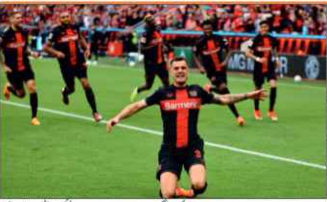
ویب ڈیسک/مشہور زمانہ سائبر سپاؤزی عمارت ہارڈوورس ہاؤس کی کوچنگ کی ہدایت میں فٹ بال کلب ہارڈوورس کوزن کی طرف سے چیمپئنس بائریلیون کوزن میں فٹ بال کانسیا چیمپئنس کا ٹائٹل جیتنے میں کامیاب ہو گیا ہے۔ ہارڈوورس کوزن آکرچہ پانچ مرتبہ ہارڈوورس کوزن کے دوسری پوزیشن حاصل کرنے میں کامیاب ہوا تھا تاہم ابھی تک وہ پانچ مرتبہ ہارڈوورس کوزن کے ٹائٹل جیتنے میں کامیاب نہیں ہو سکا تھا۔

ہارڈوورس کوزن کی کوچنگ کو اہم قرار دیا جا رہا تھا لیکن جیتنے کے حوالے سے کسی نئی بات دی گئی تھی۔ چیمپئنس بائریلیون کوزن کے حوالے سے کسی نئی بات دی گئی تھی۔ چیمپئنس بائریلیون کوزن کے حوالے سے کسی نئی بات دی گئی تھی۔ چیمپئنس بائریلیون کوزن کے حوالے سے کسی نئی بات دی گئی تھی۔