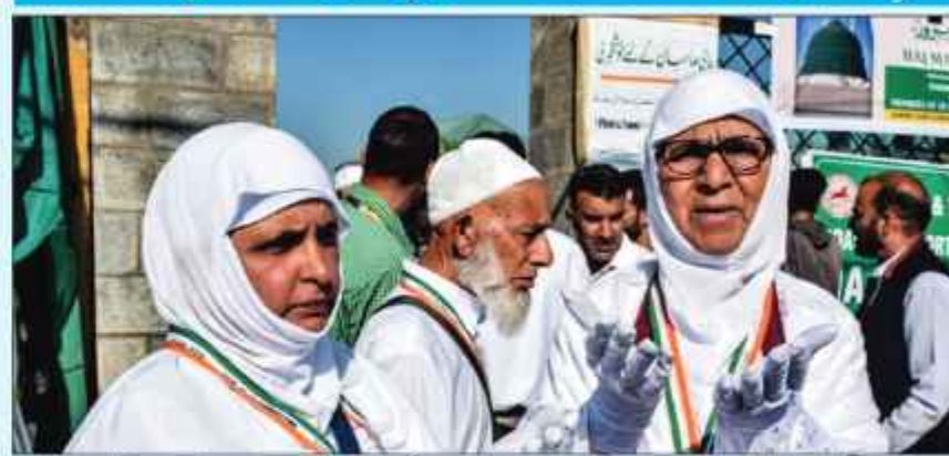
سرینگر 09 مئی //

سرینگر ہوائی اڈے سے 642 عازمین پر مشتمل دو قافلے جدہ کیلئے روانہ