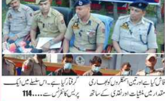
گرفتار کیا ہے۔ اس سلسلے میں ایک... 114

50 کروڑ کی منشیات نقدی برآمد، تین اسمگلر گرفتار: ایس ایس پی بارہمولہ