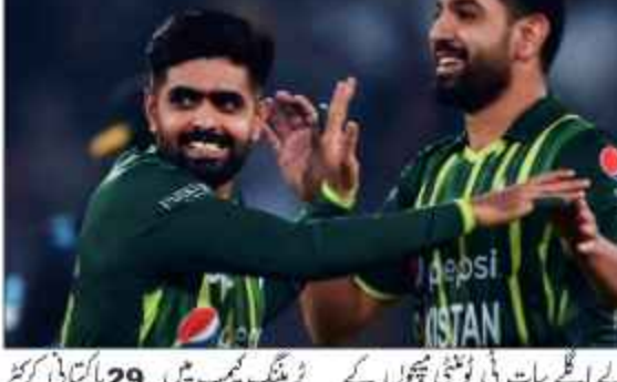
حادثہ روٹ کرکٹ تک دوبارہ فٹ ہو جائیں گے، بابراعظم پر امید۔ حادثہ روٹ کرکٹ تک دوبارہ فٹ ہو جائیں گے، بابراعظم پر امید۔ حادثہ روٹ کرکٹ تک دوبارہ فٹ ہو جائیں گے، بابراعظم پر امید۔