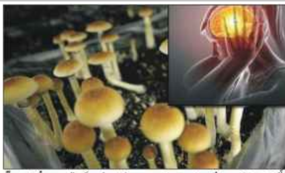
سائیکوساٹین کو مختلف دماغی، نفسیاتی اور اعصابی امراض کے علاج میں مفید پایا گیا ہے جن میں تشویش (انکوائٹی) اور اضمحلال (ڈپریشن) بھی کیفیات بھی شامل

ہیں۔ عسروں پر پھیلی ہوئی غیر عمدتہ اطلاعات کے مطابق، ماٹنگرین کے بہت سے مریضوں نے سائیکوساٹین کا شکر کرنے کے بعد دوسرے نمایاں طور پر کم ہونے کے بارے میں بتایا تھا، تاہم اس حوالے سے باضابطہ سائنسی تحقیق کی ضرورت باقی تھی۔ نیل اسکول آف میڈیسن میں اعصابیات و نفسیات کی اسٹنٹ پروفیسر ایمانوئل شٹارک کی قیادت میں یہ تحقیق 10 مہینوں کا دور پر کی گئی جو ماٹنگرین کے مریض تھے۔