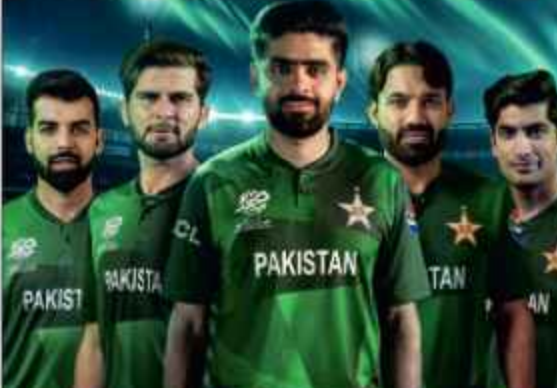
ٹی 20 ورلڈ کپ کے آغاز دو جون سے امریکہ اور ویسٹ انڈیز میں ہو گا۔ ٹی 20 ورلڈ کپ میں پاکستانی ٹیم اپنا پہلا میچ 6 جون کو ٹی 20 ورلڈ کپ میں میزبان امریکہ کے خلاف کھیلے گی۔ ٹی 20 ورلڈ کپ سے قبل پاکستانی ٹیم تین ٹی 20 میچوں کی سیریز کھیلنے پہلے آسٹریلیا اور پھر چار ٹی 20 میچوں کی سیریز کے لیے انگلینڈ روانہ ہوگی۔