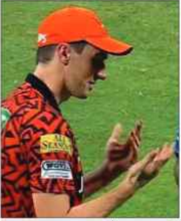
پہلی ٹیسٹ کی ٹی ٹی وی کا حصہ کیا ہے