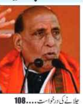
چلانے کی درخواست... 108

پارٹی امیدوار کی حمایت میں کرگل میں عوامی ریلی سے خطاب کریں گے