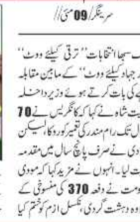
سرینگر 09 مئی //

سرینگر 09 مئی // لوک سبھا انتخابات "ترقی کیلئے ووٹ" اور جہاد کیلئے "ووٹ" کے مابین مقابلہ ہے کی بات کرتے ہوئے وزیر داخلہ امتیاز شہ نے کہا کہ کانگریس نے 70 سال تک رام مندر کی تعمیر کو روکا، اس کیلئے مقدمہ جیت لیا۔ انہوں نے مزید کہا کہ مودی نے صرف پانچ سال میں مقدمہ جیت لیا۔ انہوں نے مزید کہا کہ مودی حکومت نے 370 کی منظوری کے علاوہ دہشت گردی، نسل انہدام اور دیگر جرائم کیلئے 102 فیصد ریزرویشن دے دیا۔