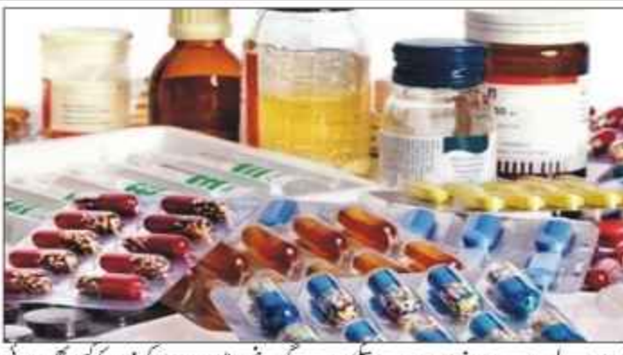
آسان طریقے سے درخواست دے سکیں گی۔ اسی میں دواساز کمپنیوں کو بھی دوائی کے اجازت نامہ کے حصول کی جلد اور با

اسلام آباد: ڈریپ ریگولیشن اتھارٹی آف پاکستان (ڈریپ) نے امریکی حکومت کے آسٹریک سے ادویات کے محفوظ ہونے اور تاثیر کی جلد اور موثر جانچ پڑتال کے آئن لائن پلیٹ فارم کا اجراء کیا ہے۔ حکومت پاکستان اور امریکا نے مشترکہ طور پر امریکی ادارہ برائے بین الاقوامی ترقی (ایف ڈی ای) کے توسط سے مذکورہ پلیٹ فارم تشکیل دیا ہے تاکہ دواسازی کے بین الاقوامی معیار کی پاسداری کی جاسکے۔ پاکستان انٹیر نیٹو اسلام آباد: ڈریپ ریگولیشن اتھارٹی آف پاکستان (ڈریپ) نے امریکی حکومت کے آسٹریک سے ادویات کے محفوظ ہونے اور تاثیر کی جلد اور موثر جانچ پڑتال کے آئن لائن پلیٹ فارم کا اجراء کیا ہے۔ حکومت پاکستان اور امریکا نے مشترکہ طور پر امریکی ادارہ برائے بین الاقوامی ترقی (ایف ڈی ای) کے توسط سے مذکورہ پلیٹ فارم تشکیل دیا ہے تاکہ دواسازی کے بین الاقوامی معیار کی پاسداری کی جاسکے۔ پاکستان انٹیر نیٹو