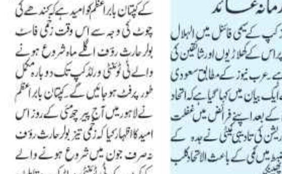
40 ہزار یال جسرمانہ عام۔ 40 ہزار یال جسرمانہ عام۔ 40 ہزار یال جسرمانہ عام۔