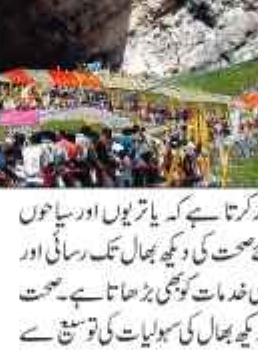
سرینگر 09 مئی //

یاتریوں کو طبی سہولیات بہم رکھنے کیلئے تمام تر اقدامات