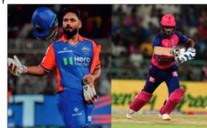
جی لائک (گوانی) ان کی ٹھیری صحت سے متاثر ہوا ہے۔ اسے نام پر 380 رنز اور تین موثر نصت پھریں کے ساتھ پنت ایک بار پھر مظاہر کرنا چاہیں گے خاص طور پر جب ان کی ٹھوٹھل میں ڈال دیا گیا ہو۔ ان کے پاس نئے آسٹریلوی سٹنٹی فیز پز ریمک گرگ ہوں گے جو کوشہ دو گیز میں فٹات سے پاس ہو چکے ہیں۔ یہ دونوں بیڑس انفرادی طور پر ٹھیل لائک بل سکتے ہیں لیکن ڈی سی کو اڑنی بولنگ شھبہ کے ساتھ ایک ٹھوٹھو ہوا ہے۔

ہوٹا رہیں گے۔ جو کھیل میں سوانی ماں سمجھے کے مقابلے میں بہت مختصر ٹیمیں کھیں گے۔ گراؤ پندر چھل اور وی پندر اٹھن بیٹے اپنی کارناما کرنا آسان نہیں ہے اور تجربہ کار نڈس شرماسی آکر کے پاس ایک بہترین بلر ہے جو گیندوں کو تیز کر سکتا ہے۔ راجستھان کا بولنگ شعبہ معقول اکانوی ریٹ برقرار رکھنے میں کامیاب رہا ہے لیکن ڈی سی کے لیے صرف آکرچہ (7.24) اور گندھپ (8.45) نے فٹات بیڑ کر کے کام کیا ہے۔ اب وقت آ گیا ہے لیٹل (9.47) اور میٹھل (11.05) بھی زیادہ مختصر موانی دکھائیں۔ جنوبی افریقی فٹات بلر لیزا (2) گیز میں (12) اور لیٹل فٹات بلر لیزا (13.36) نے اس حصے کو نہیں دیکھا۔ آخری بار وہوں ٹیموں کی ملاقات مارچ میں ہے پورس ہونی تھی اور پور ڈی سی نے اپنی بولنگ اننگز کے دوسرے ہاف کے دوران ریپن کی ٹائڈر اننگز ٹیمیل کر کے ٹھوڑا کھو دیا تھا۔ ریپن کھپان چیمپئنس ٹیمسٹھو کی کے ساتھ ساتھ ٹھوڑے دو تین پاول ٹھرون ٹھما اور ہر دور مل مال ٹھیری ٹھانگ شھبہ ایک بہت ہی ٹھوفا کھیل دیتے ہیں