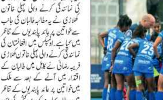
دورہ یورپ کھیلنے ہندوستانی جوڈو بانی ٹیم کا اعلان۔ دورہ یورپ کھیلنے ہندوستانی جوڈو بانی ٹیم کا اعلان۔ دورہ یورپ کھیلنے ہندوستانی جوڈو بانی ٹیم کا اعلان۔