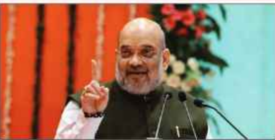
میٹنگ کی صدارت کی۔ میٹنگ میں وزیر داخلہ اور امراتھ یاترا کی تیاریوں کا لیا گیا جائزہ

جموں و کشمیر کی مجموعی سیکورٹی صورتحال اور امراتھ یاترا کی تیاریوں کا لیا گیا جائزہ