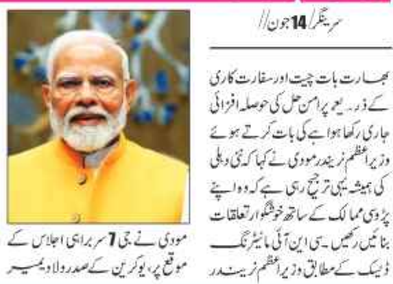
مودی نے جی 7 سربراہی اجلاس کے موقع پر یوکرین کے صدر ولادیمیر پوتن کے ساتھ ملاقات کی۔

نئی دہلی 14 جون // وزیر اعظم نریندر مودی نے اٹلی پہنچ گئے۔ جی 7 سربراہی اجلاس میں شرکت کے لیے اٹلی پہنچ گئے۔ مودی نے جی 7 سربراہی اجلاس کے موقع پر یوکرین کے صدر ولادیمیر پوتن کے ساتھ ملاقات کی۔