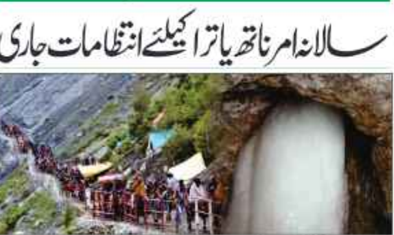
سخت انتظامات کے جاری ہیں وہیں جموں کشمیر ڈیزاز پورٹ کی جانب سے یاتریوں کی سہولیات۔ 105