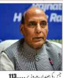
جس کی صدارت وزیر۔ 113

آبدوزیں، لڑاکا طیلیدے، ہیلی کاپٹر اور ہتھیار مقامی طور پر تیار: راجناتھ